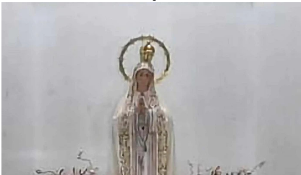
Ermita virgen de fatima policar