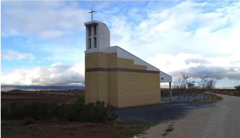
Ermita virgen de fatima iglesia