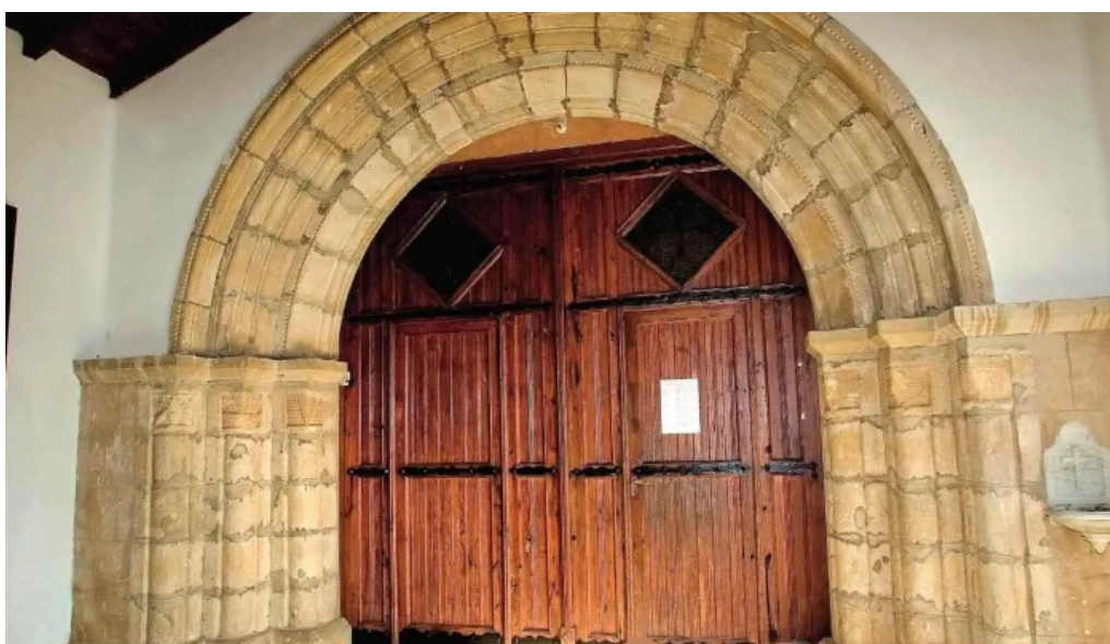
Iglesia de nuestra senora de la asuncion pobes