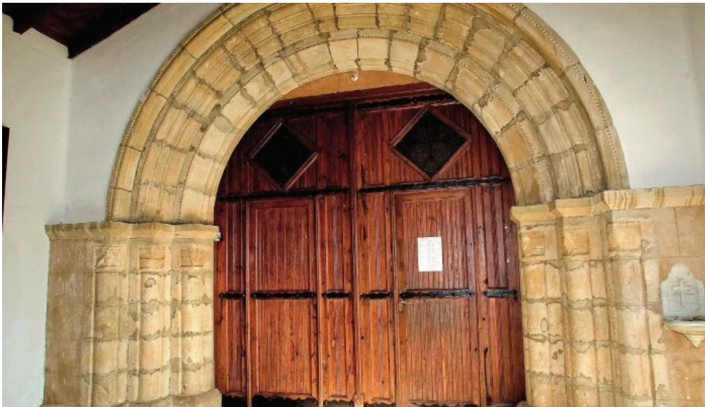
Iglesia de nuestra senora de la asuncion iglesia