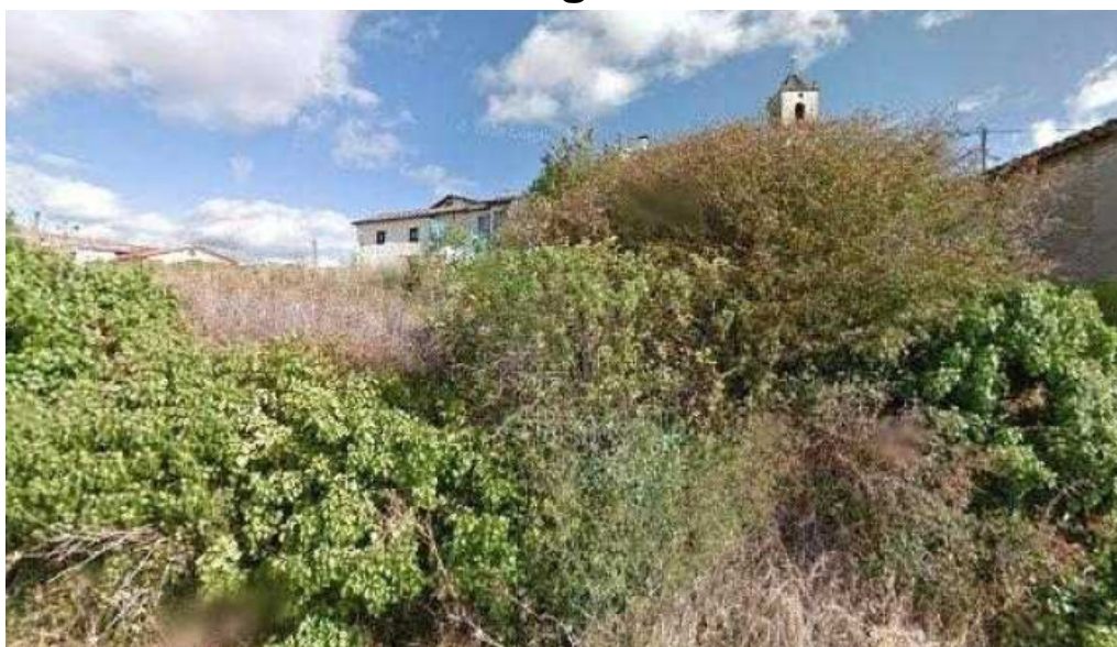
Iglesia de nuestra senora de la asuncion puntaje