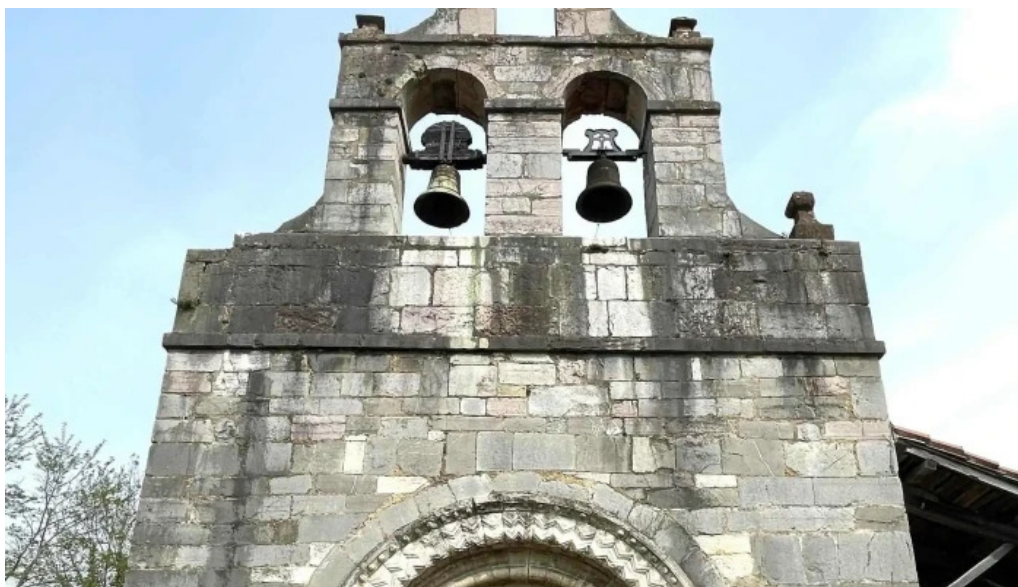
Iglesia de san martin catalogo