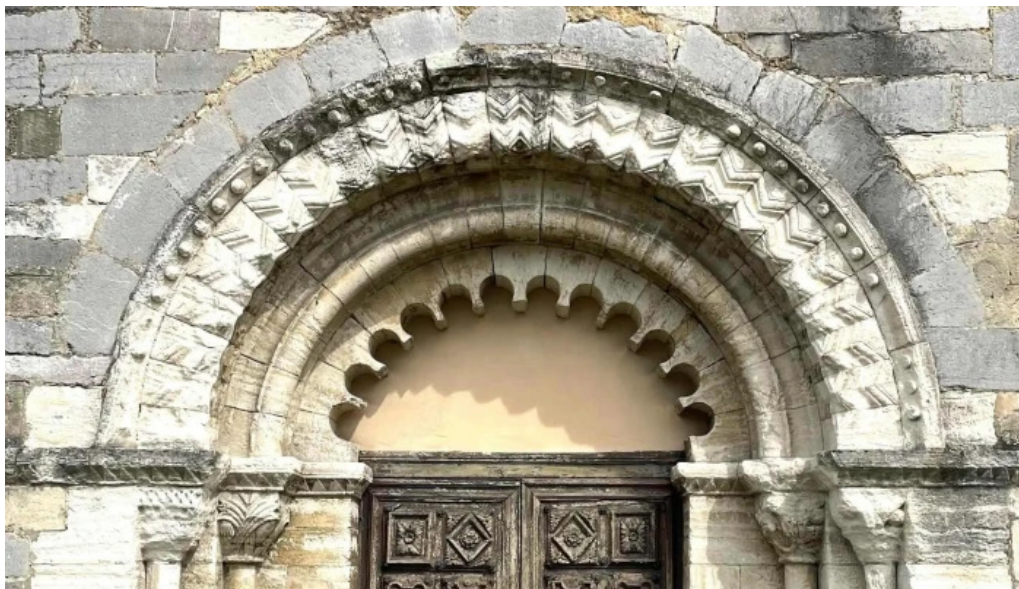
Iglesia de san martin instagram