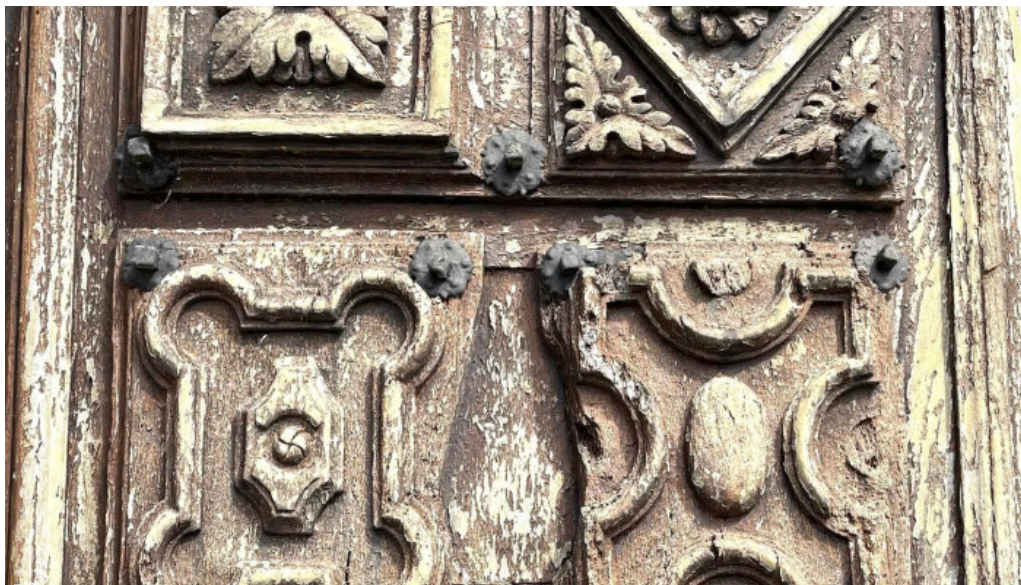
Iglesia de san martin pereda