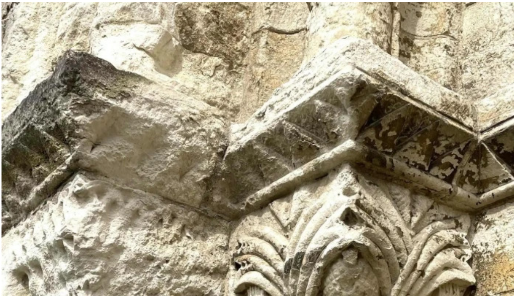
Iglesia de san martin comentarios