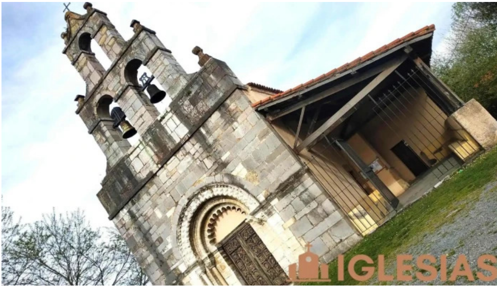
Iglesia de san martin iglesia