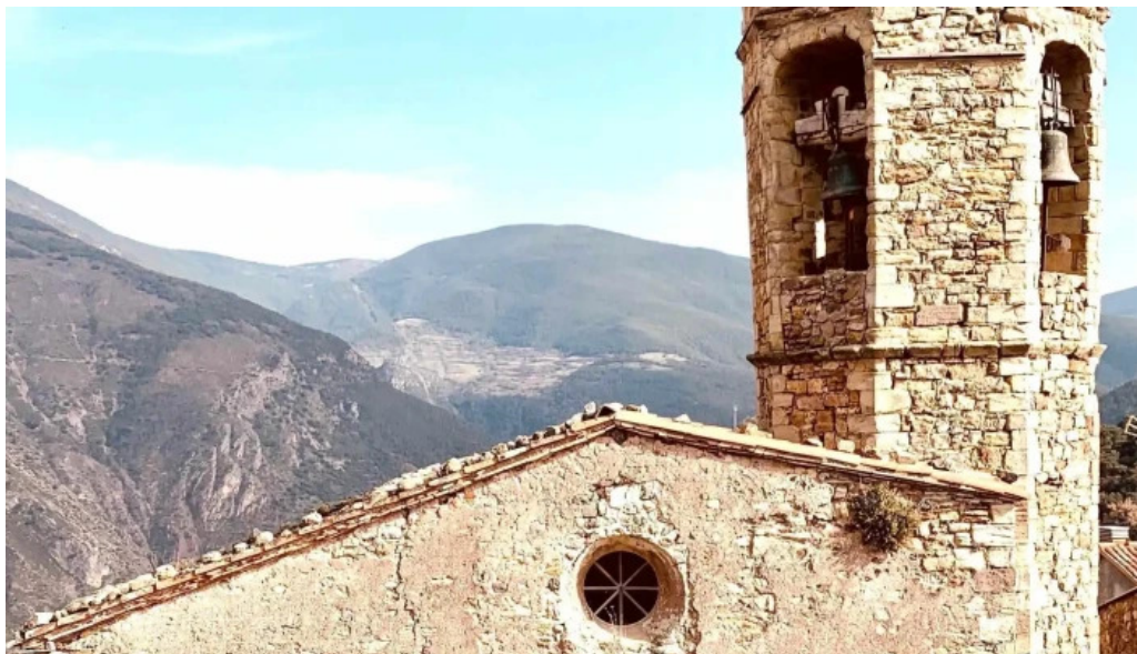
Esglesia de sant cristofol promocion