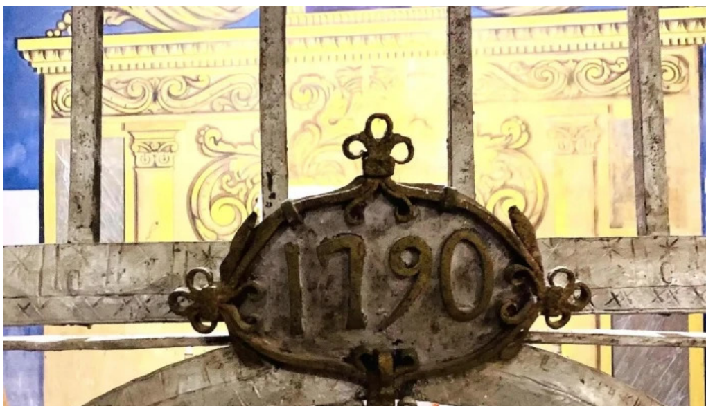
Esglesia de sant cristofol direccion