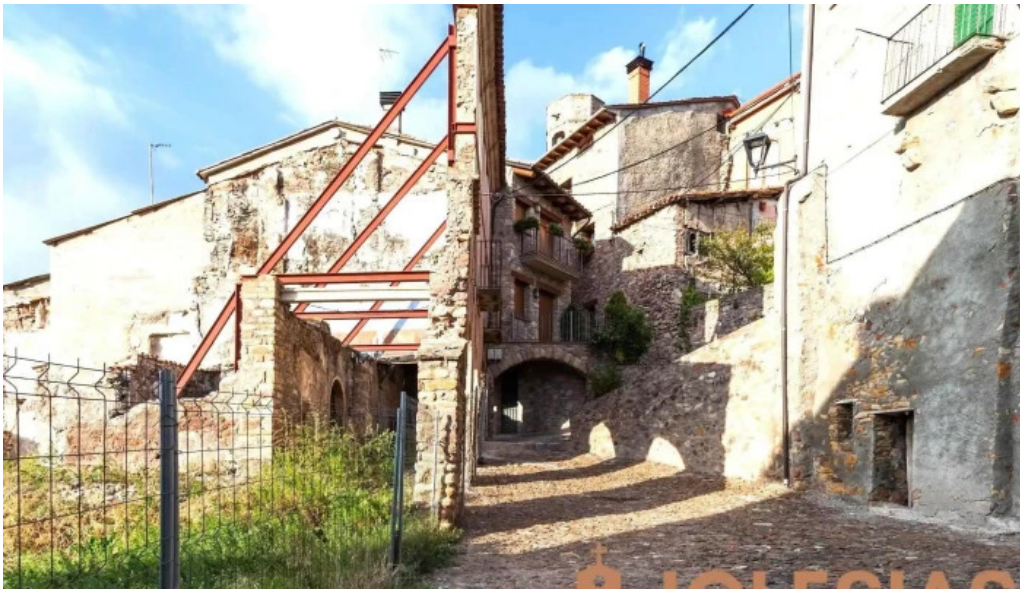
Esglesia de sant cristofol iglesia