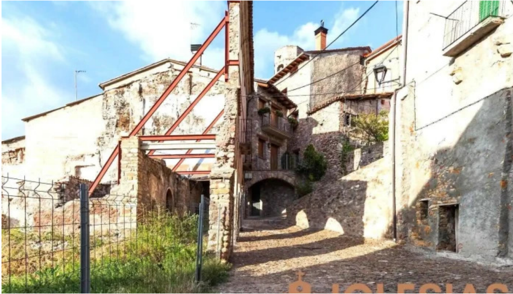
Esglesia de sant cristòfol peramea