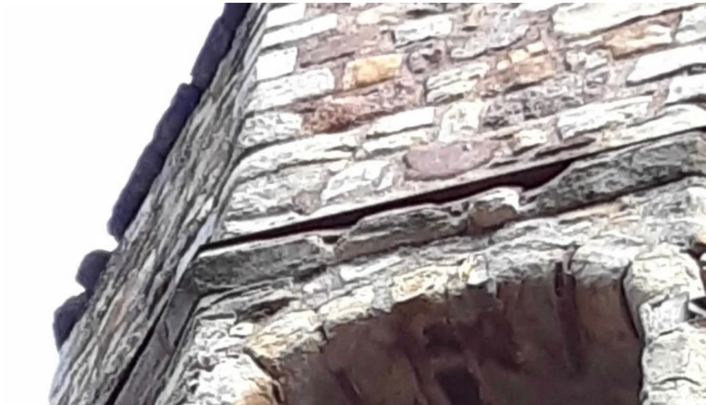
Esglesia de sant cristofol puntaje