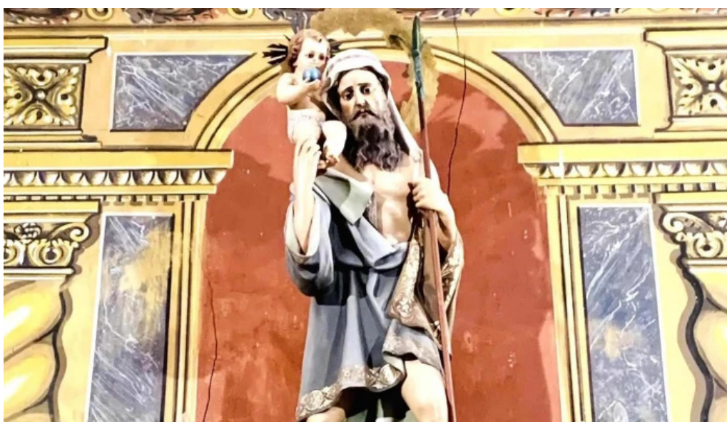
Esglesia de sant cristofol descuentos