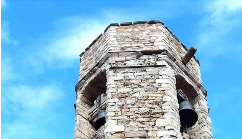
Església de sant cristofol peramea