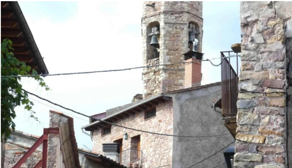
Esglesia de sant cristofol videos