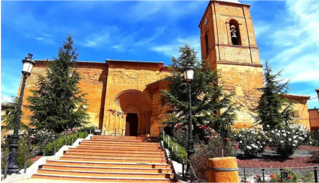
Iglesia de nuestra senora de la asuncion antiguamente de los dolores iglesia