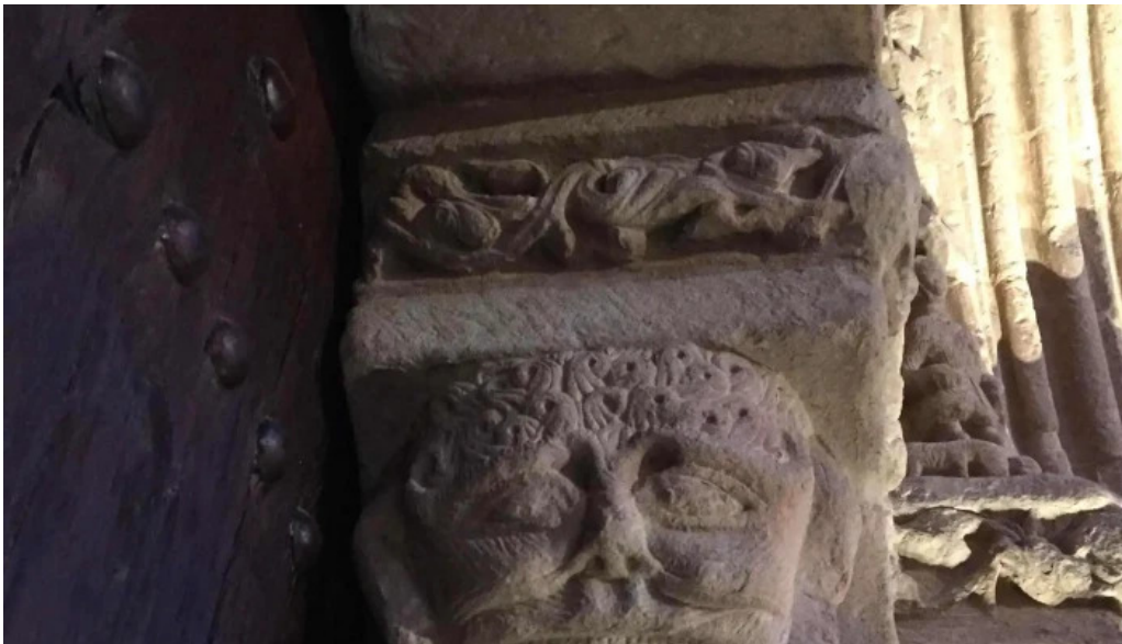
Iglesia de nuestra senora de la asuncion antiguamente de los dolores telefono