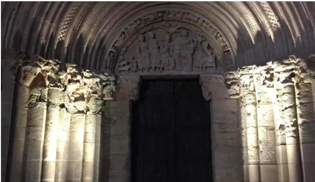
Iglesia de nuestra senora de la asuncion antiguamente de los dolores abierto ahora