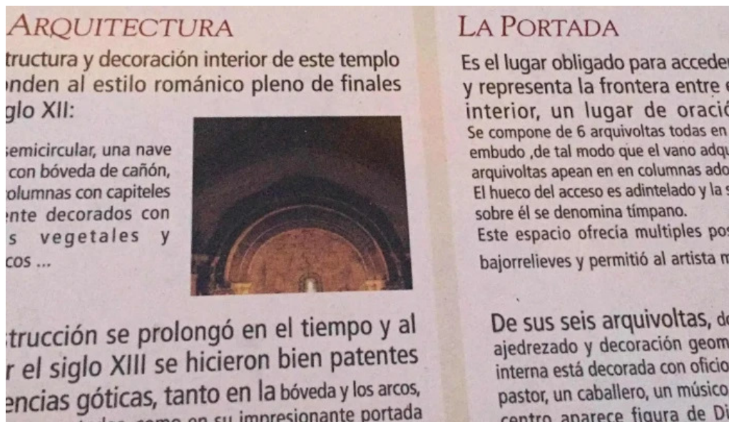
Iglesia de nuestra señora de la asuncion antiguamente de los dolores peralta de alcofea