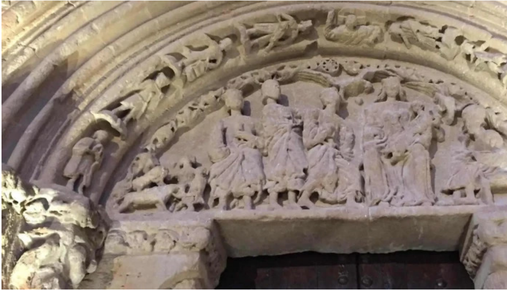
Iglesia de nuestra senora de la asuncion antiguamente de los dolores videos