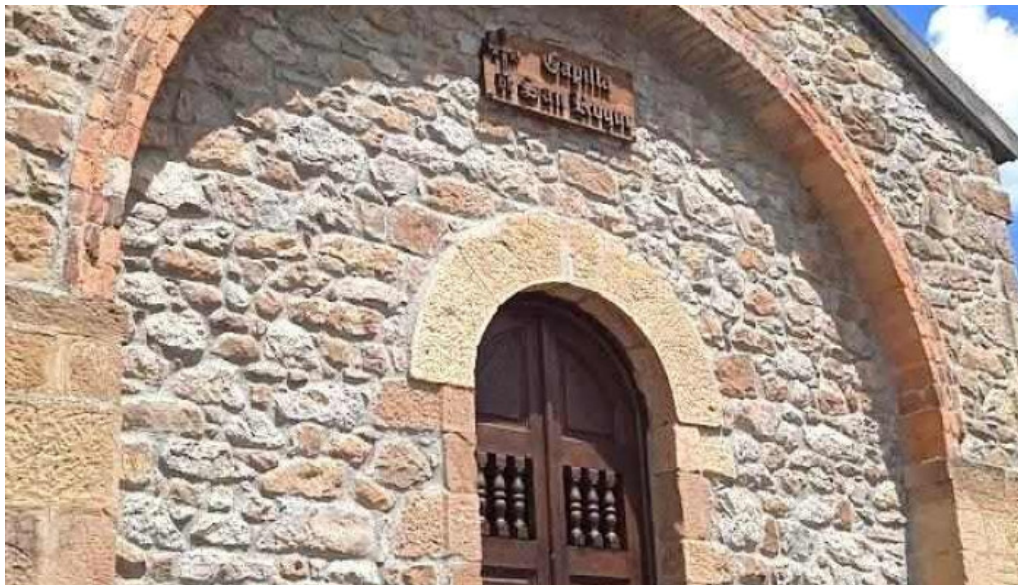
Ermita de san roque pen