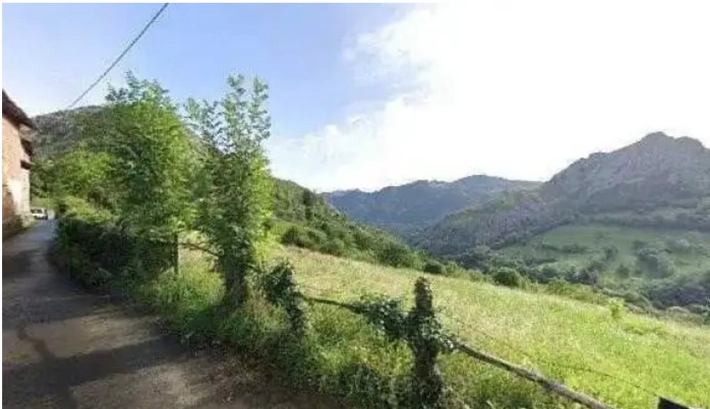
Ermita de san roque direccion