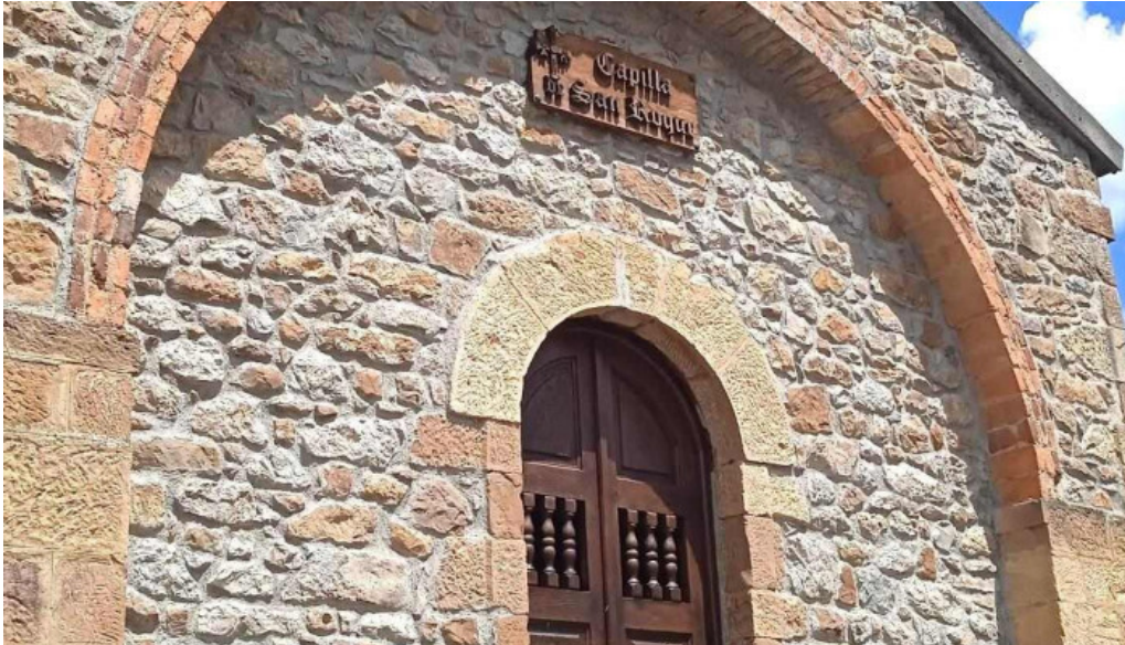
Ermita de san roque iglesia