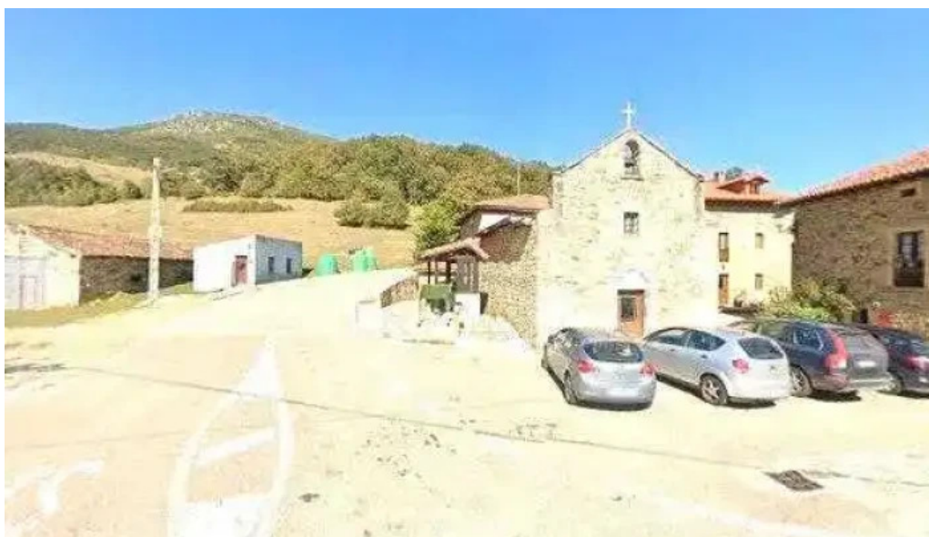
Nuestra senora de la luz iglesia