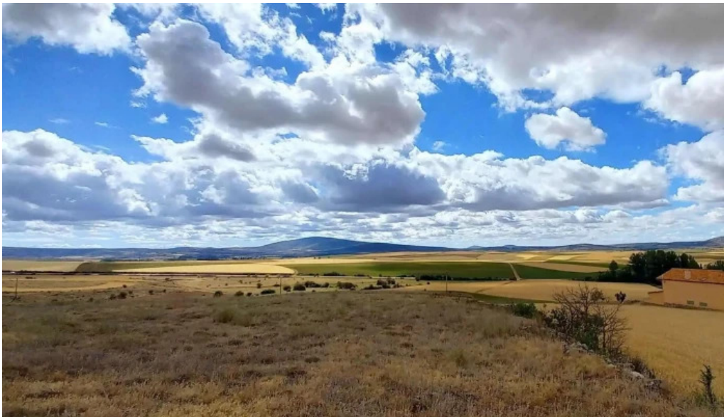
Iglesia de san cristobal descuentos