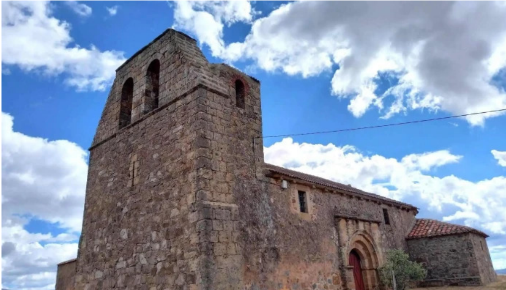
Iglesia de san cristobal iglesia