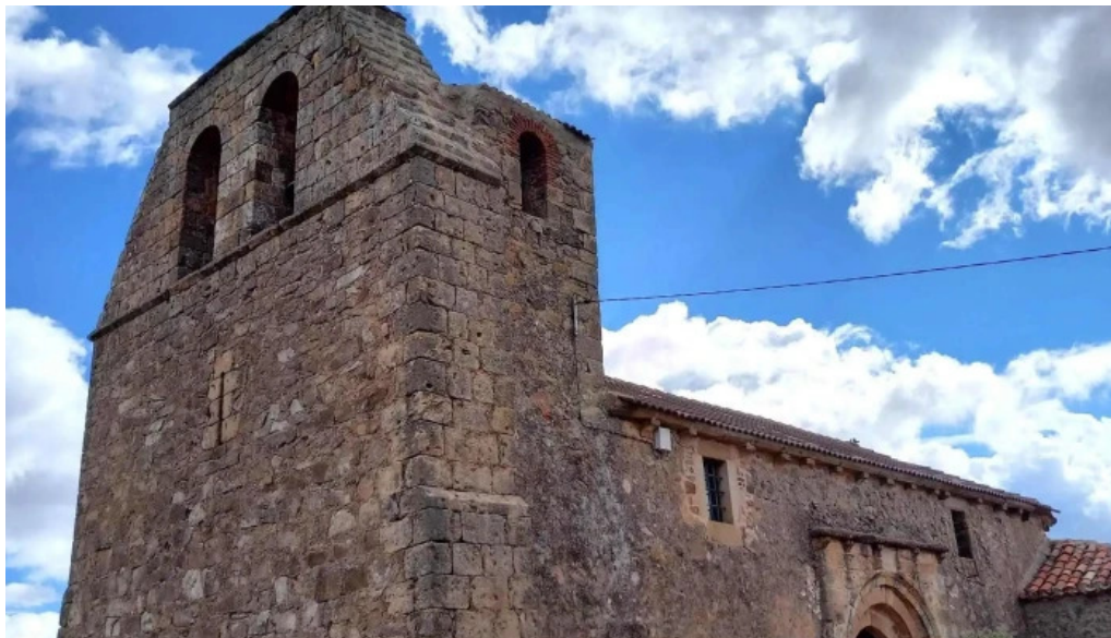
Iglesia de san cristobal pedraza