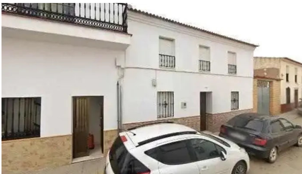
Ermita de san sebastian iglesia