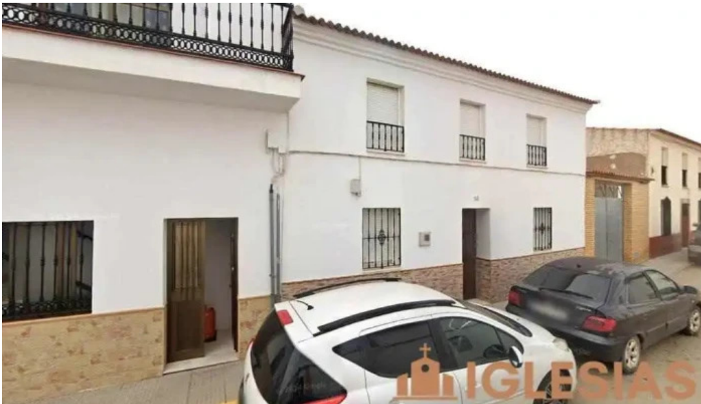
Ermita de san sebastian paymogo