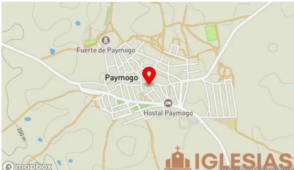
Ermita de san sebastian mapa