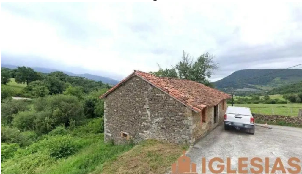
Iglesia de parearroyo partearroyo