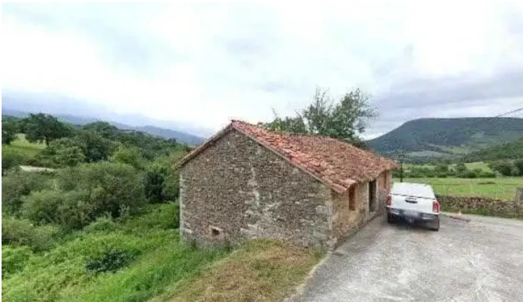
Iglesia de parearroyo iglesia