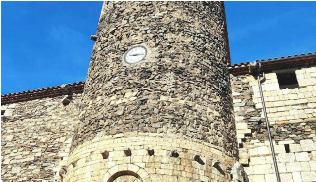
Iglesia de sant esteve de pardines iglesia