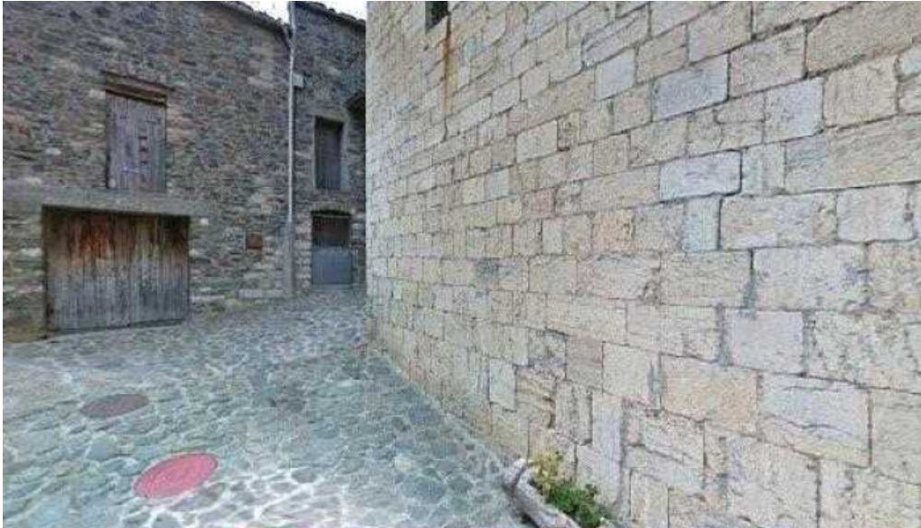
Iglesia de sant esteve de pardines donde