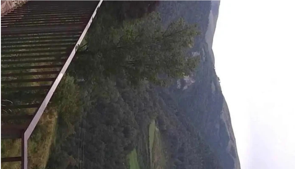
Iglesia de sant esteve de pardines videos