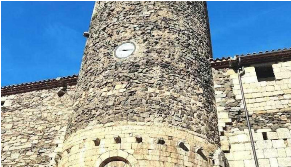
Iglesia de sant esteve de pardines pardines