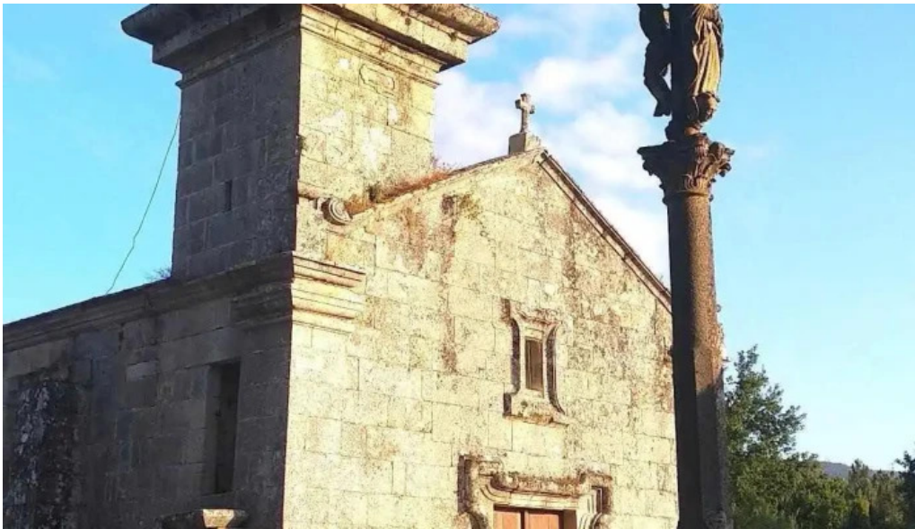
Iglesia de san pedro da torre iglesia