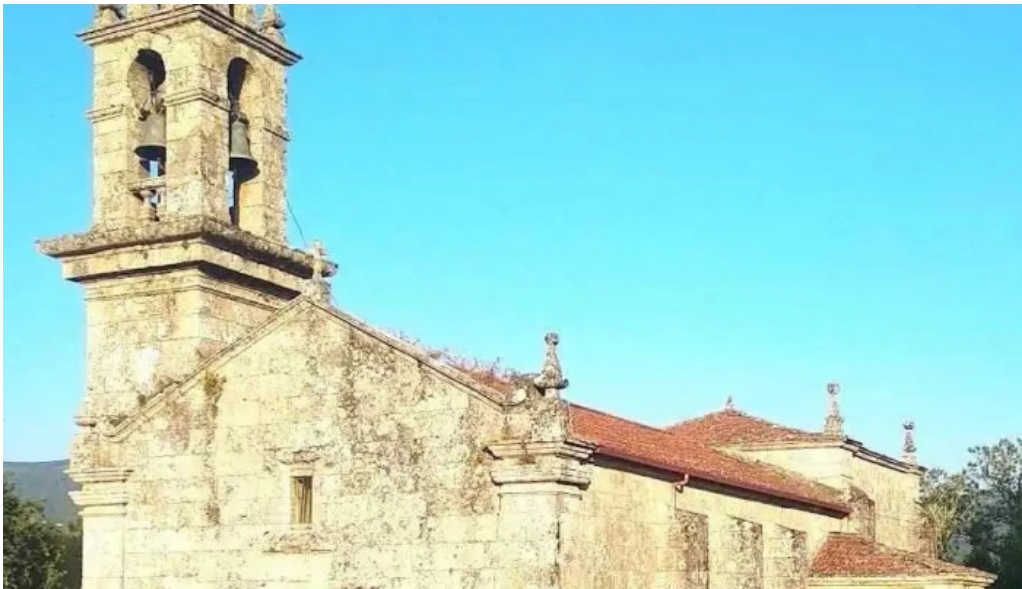
Iglesia de san pedro da torre padrenda