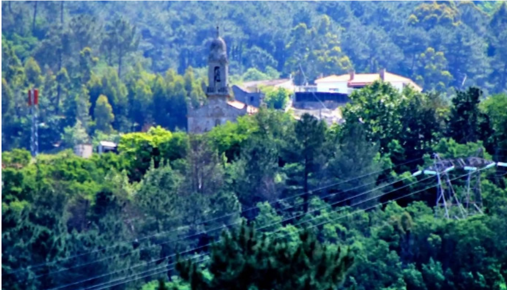
Iglesia de san pedro da torre comentario 1