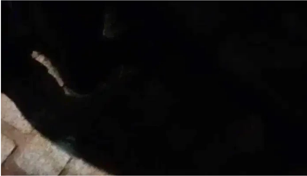
Iglesia de san pedro da torre videos