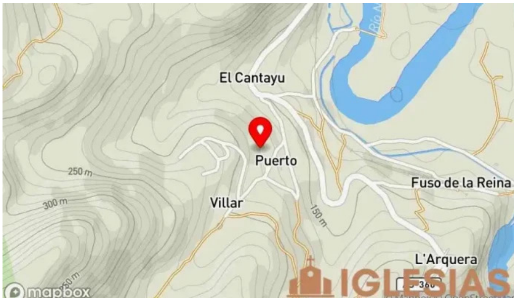
San pelayo de puerto mapa