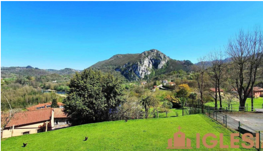
San pelayo de puerto oviedo