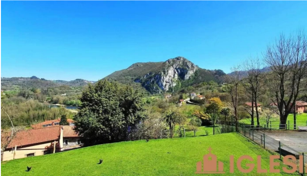
San pelayo de puerto iglesia