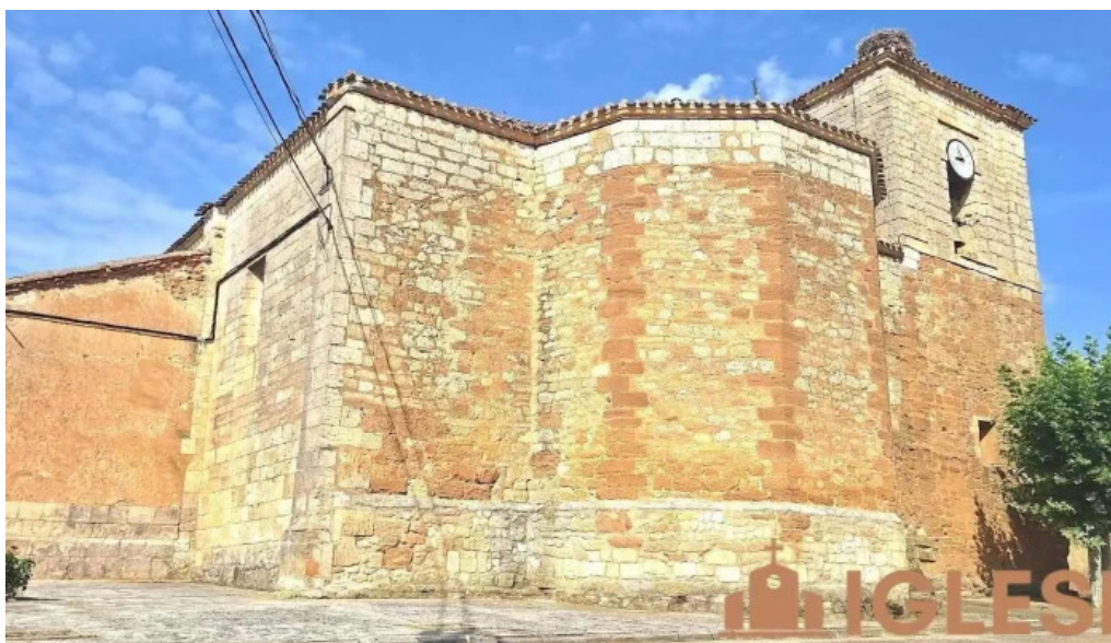
Iglesia de san cristobal osornillo