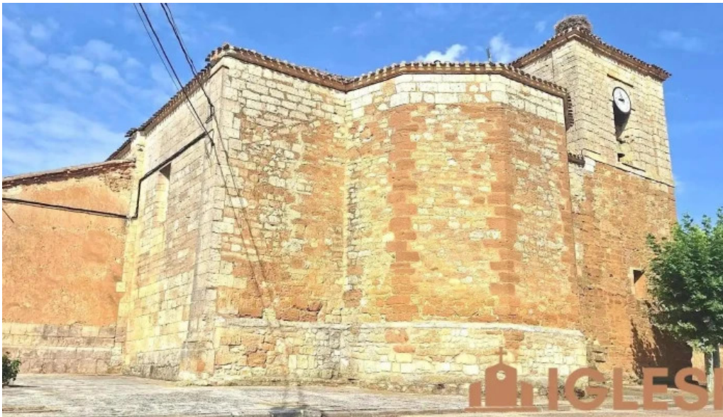
Iglesia de san cristobal iglesia