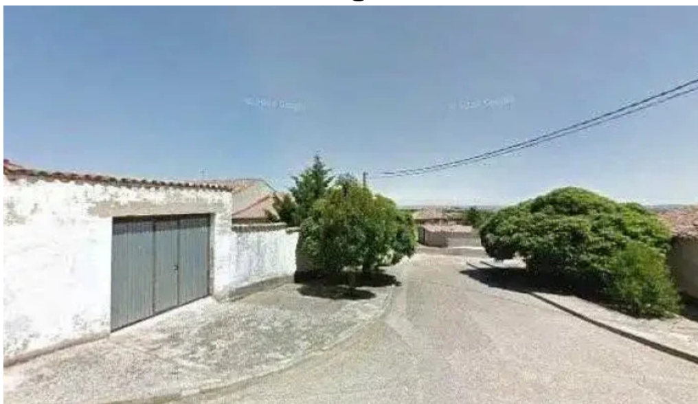
Iglesia de san cristobal precios