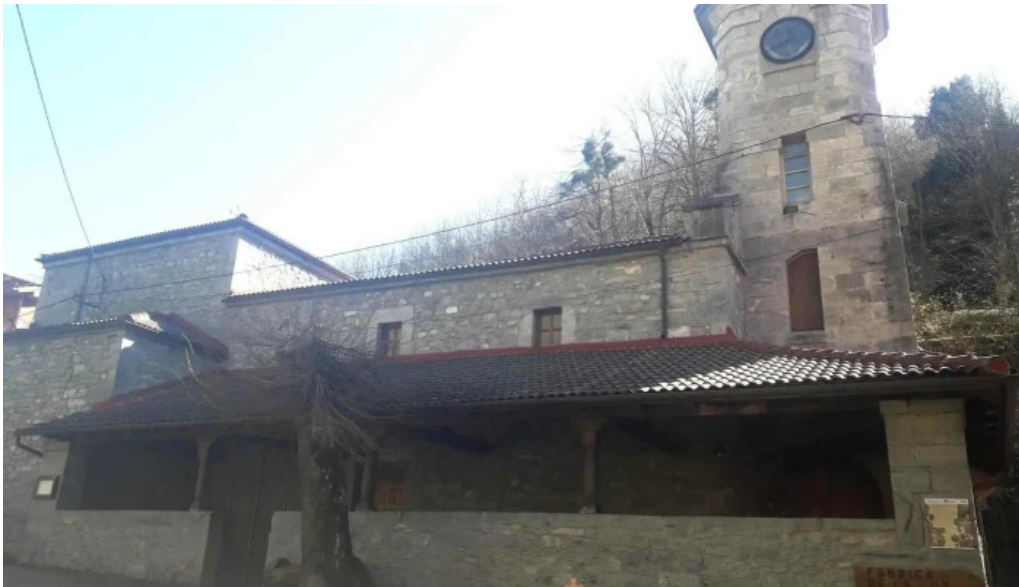
Iglesia de santa maria de las nieves iglesia