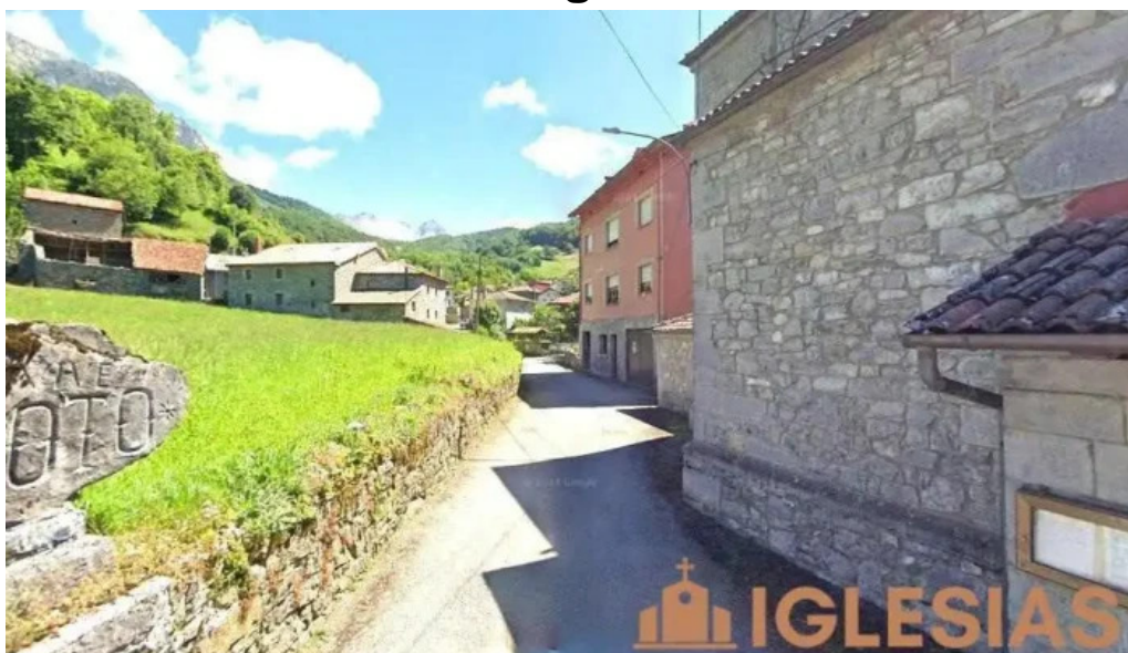
Iglesia de santa maria de las nieves oseja de sajambre