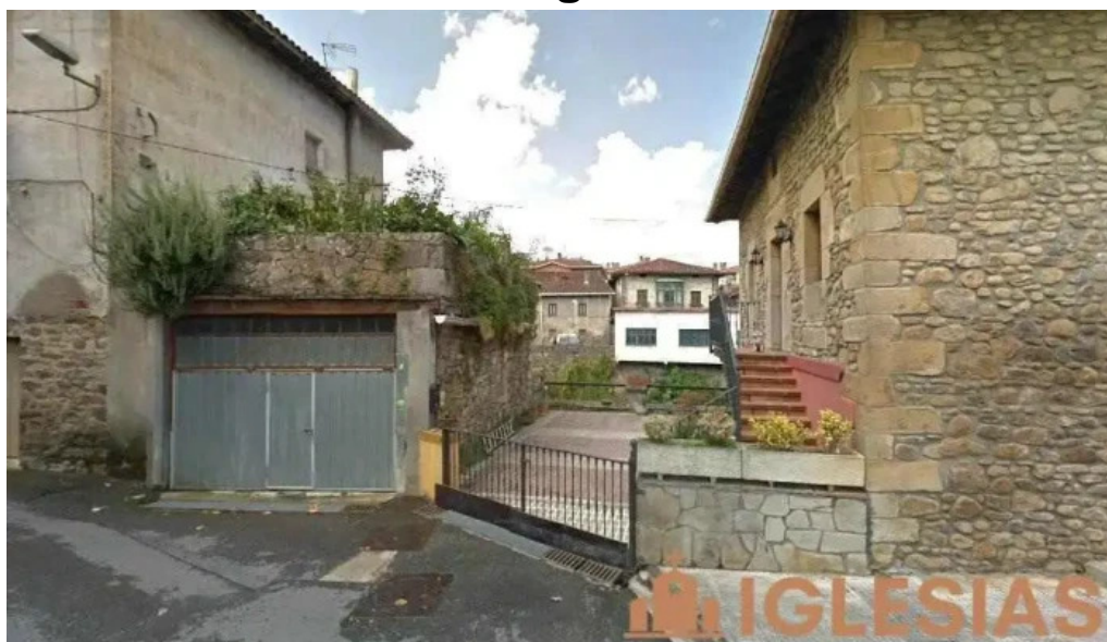
Iglesia de san bartolome apostol olarte orozko