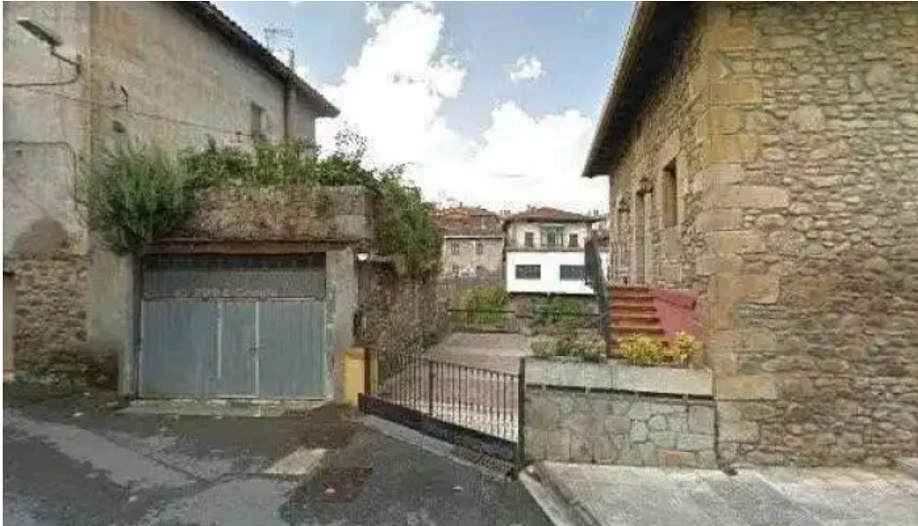
Iglesia de san bartolome apostol olarte iglesia