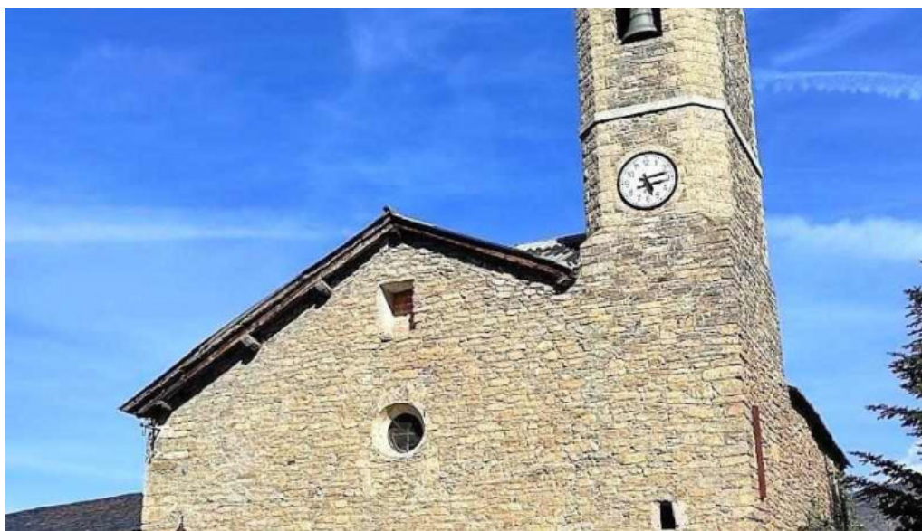
Esglesia de la mare de deu de la candelera olp