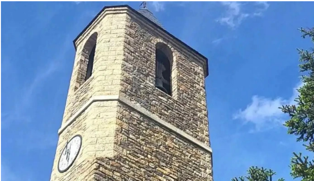
Esglesia de la mare de deu de la candelera iglesia