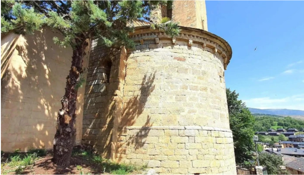
Iglesia san pedro de olopte donde