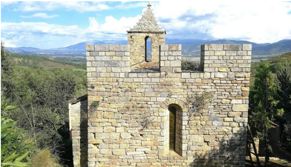
Iglesia san pedro de olopte iglesia