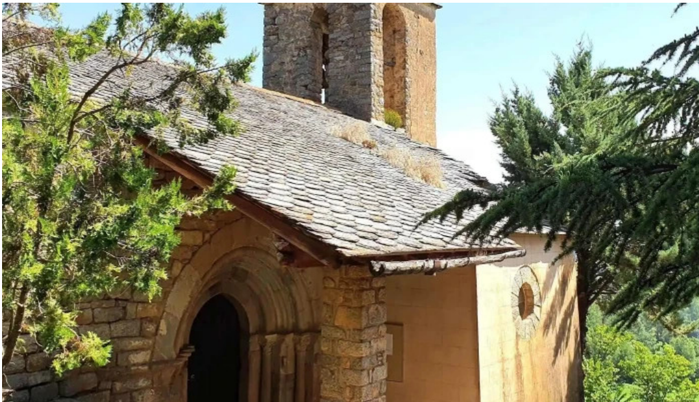
Iglesia san pedro de olopte como llegar