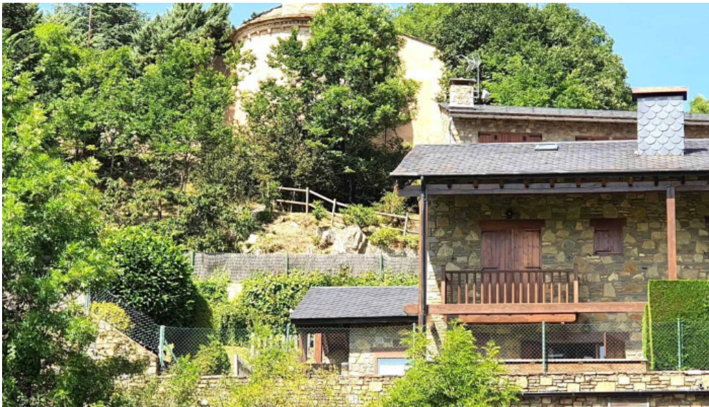
Iglesia san pedro de olopte olopte