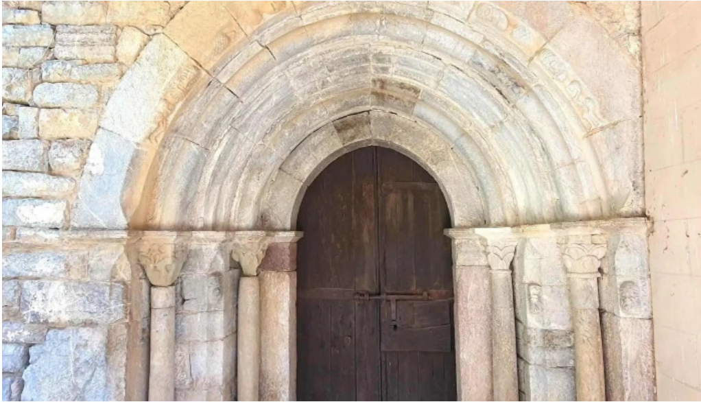
Iglesia san pedro de olopte puntaje