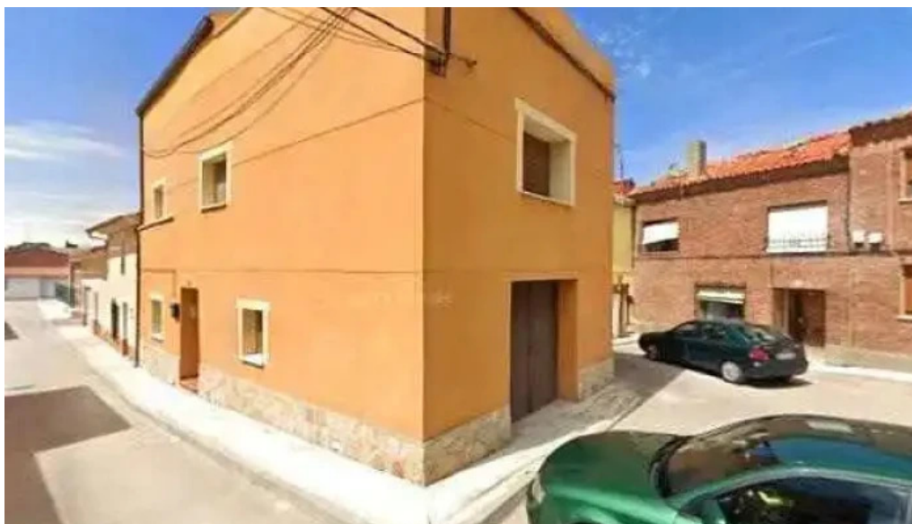
Iglesia parroquial de san pedro apostol direccion