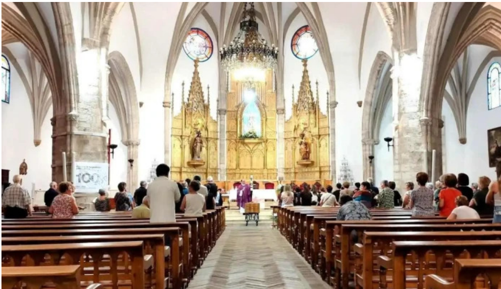
Iglesia parroquial de san pedro apostol iglesia