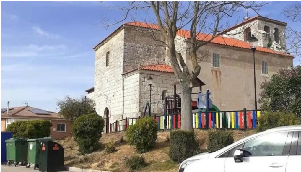
Iglesia parroquial de san pedro apostol olmos de esgueva