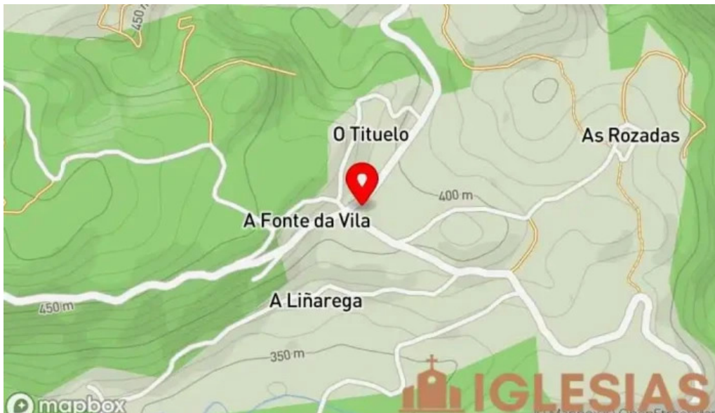
Iglesia de san jorge de o cadramon mapa