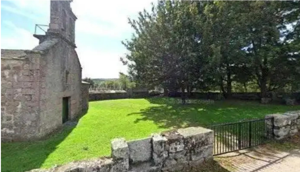
Iglesia de san jorge de o cadramon como llegar