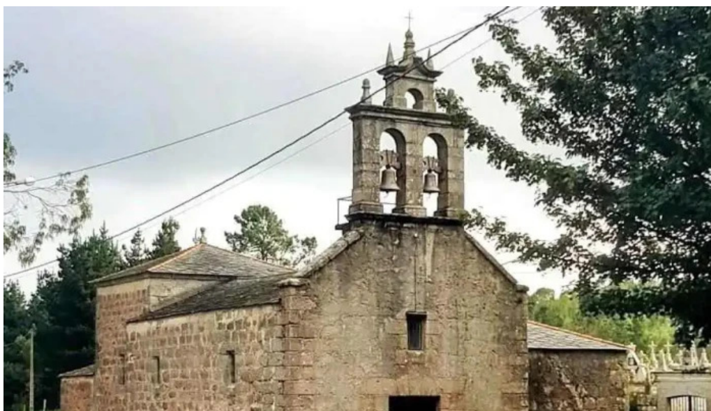
Iglesia de san jorge de o cadramon o valadouro