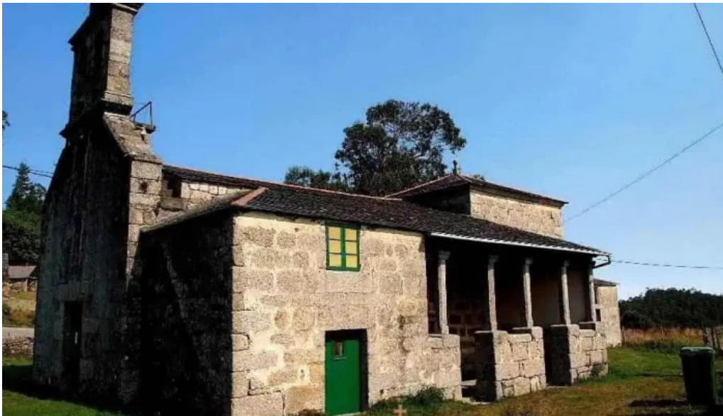
Iglesia de san jorge de o cadramon iglesia