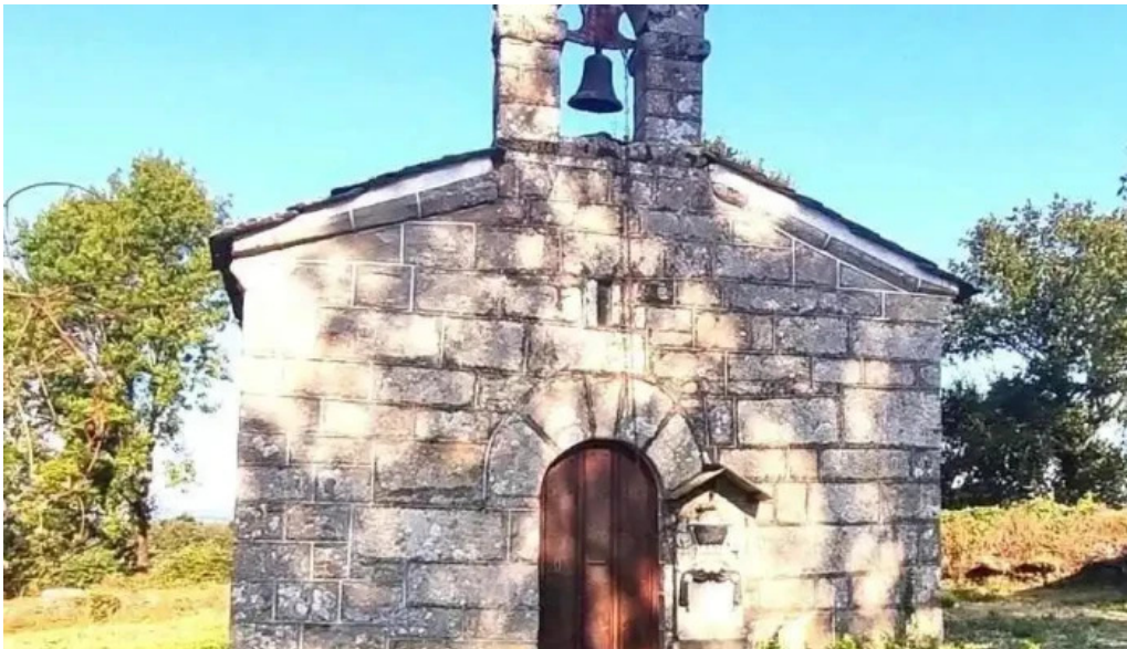
Iglesia de santiago de camoso iglesia