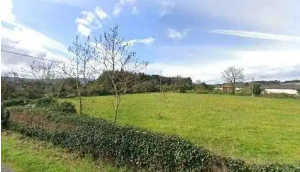
Iglesia de santiago de camoso direccion