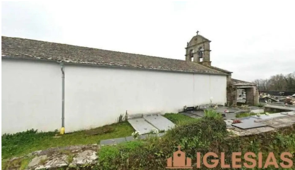
Iglesia de santa maria de marei o corgo