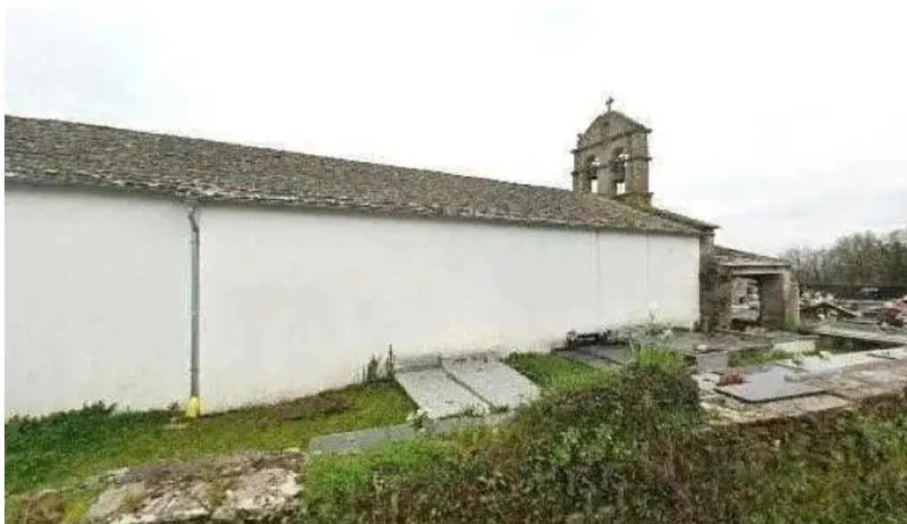
Iglesia de santa maria de marei iglesia