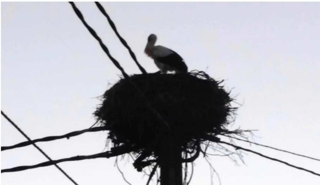
Iglesia de san pedro de cerceda o corgo