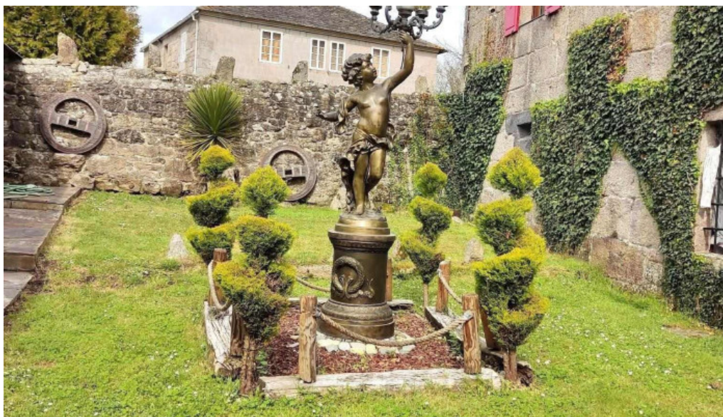
Iglesia de san pedro de cerceda iglesia