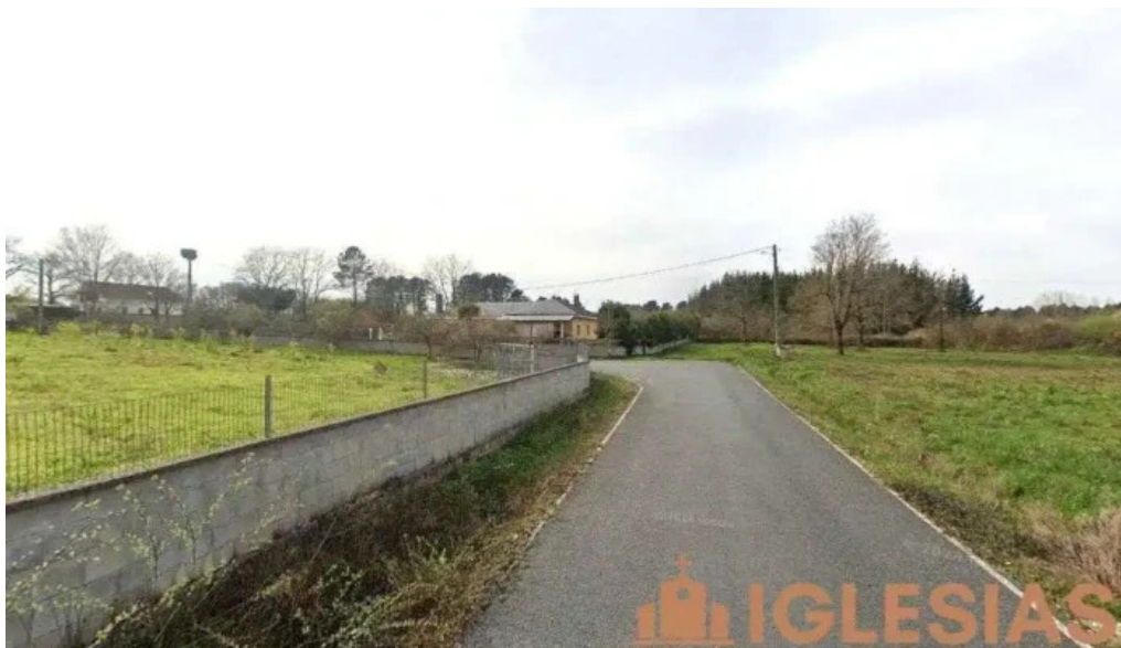
Iglesia de san fiz de paradela o corgo