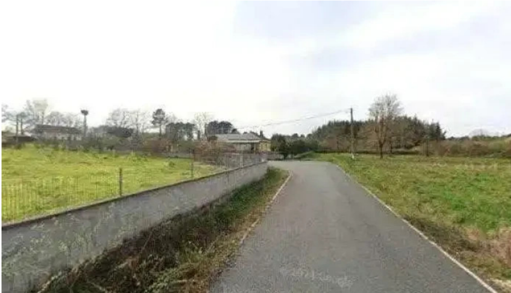
Iglesia de san fiz de paradela iglesia