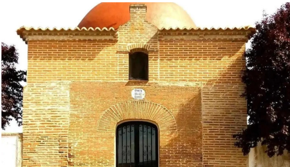
Ermita del santo cristo iglesia