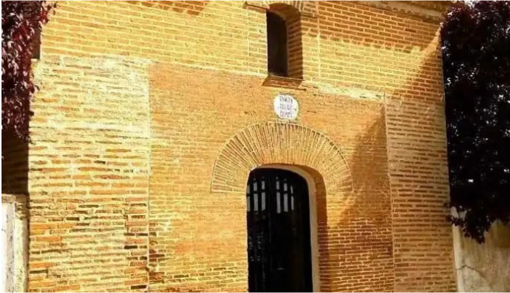
Ermita del santo cristo nueva villa de las torres