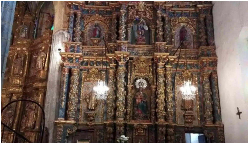
Iglesia de santa maria de la asuncion novalés iglesia