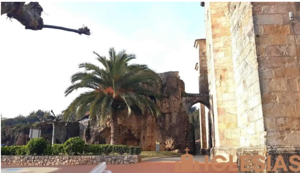
Iglesia de santa maria de la asuncion novales novales