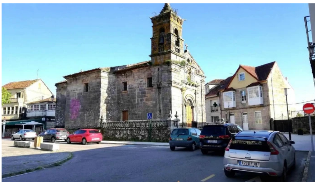
Iglesia de santa maria de las nieves iglesia