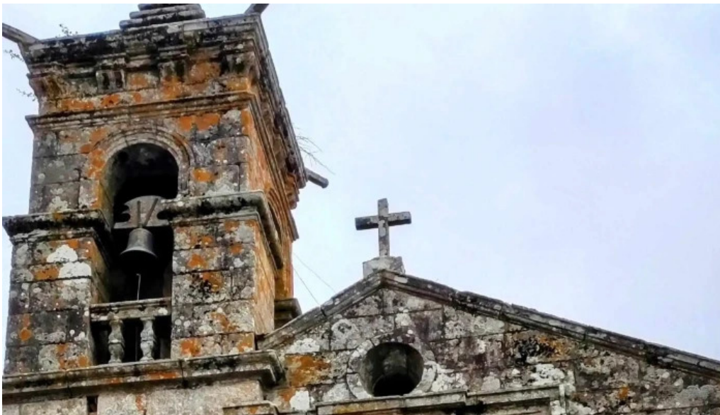
Iglesia de santa maria de las nieves nevés as