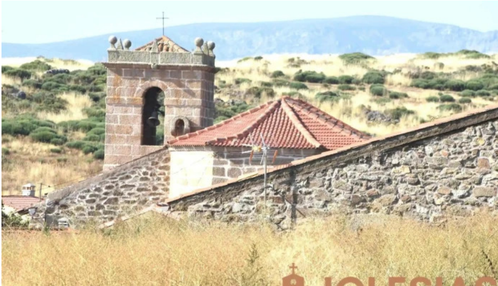
Iglesia de santa ana iglesia