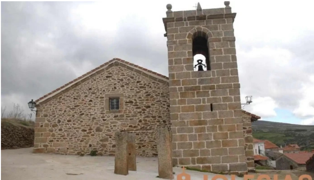
Iglesia de santa ana navasequilla