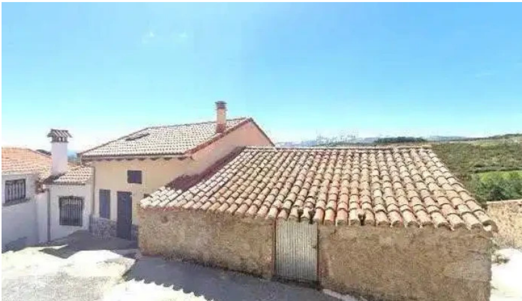
Iglesia de santa ana zona