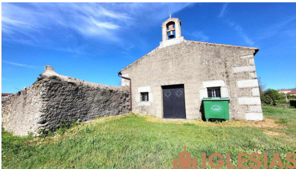
Ermita del cristo del humilladero iglesia