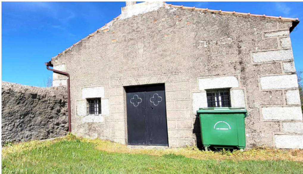
Ermita del Cristo del humilladero navarredonda de la rinconada