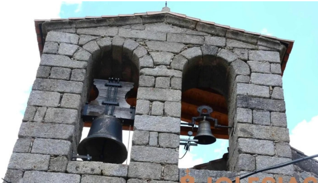
Iglesia de san martin iglesia