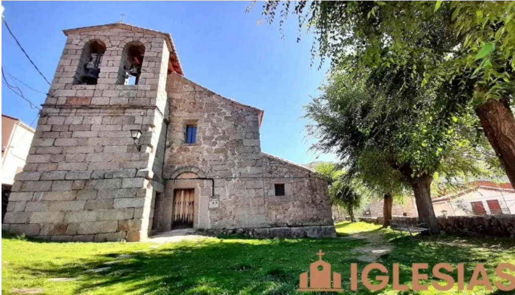
Iglesia de san martin navacedilla de corneja