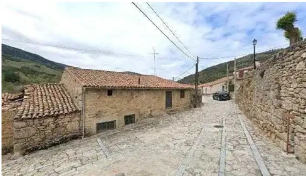
Iglesia de san martin telefono