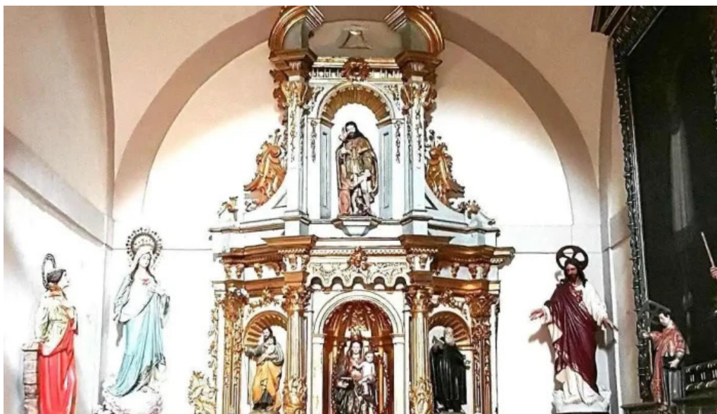
Jasokundeko andra mari eliza iglesia de nuestra senora de la asuncion iglesia