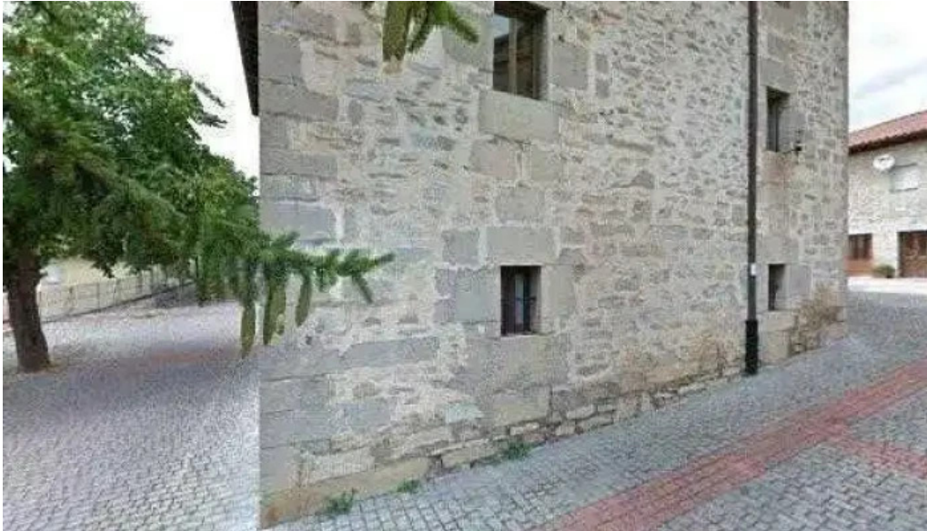
Jasokundeko andra mari elizaiglesia de nuestra senora de la asuncion nanclares