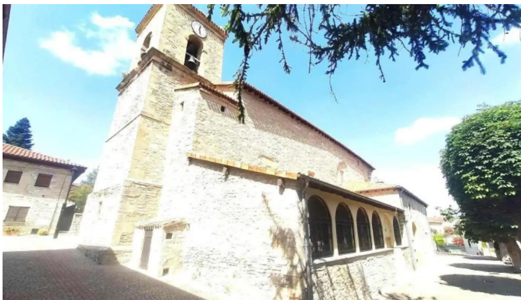
Jasokundeko andra mari eliza iglesia de nuestra senora de la asuncion nanclares de la oca