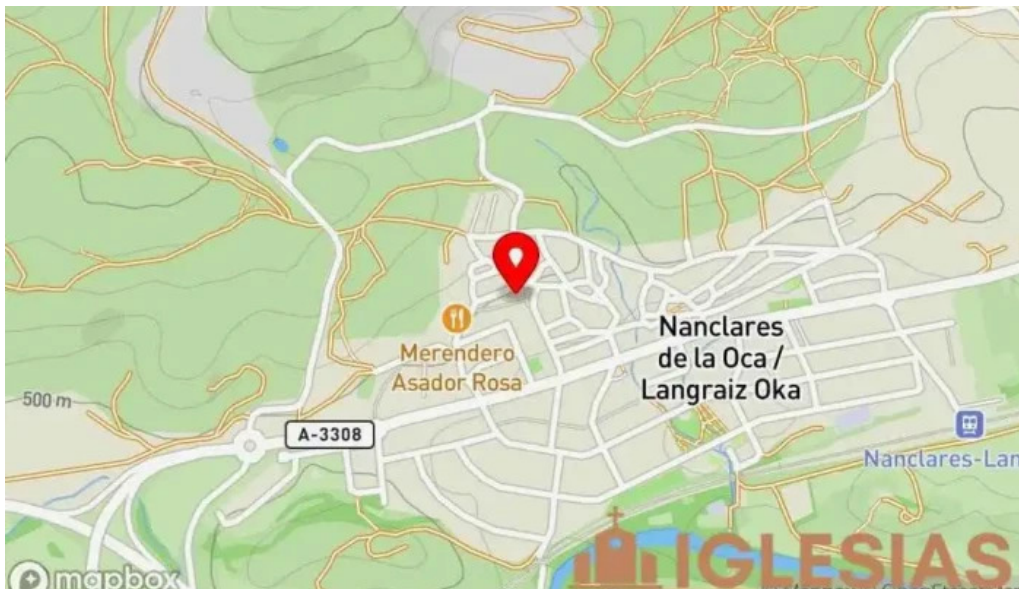
Jasokundeko andra mari elizaiglesia de nuestra senora de la asuncion mapa