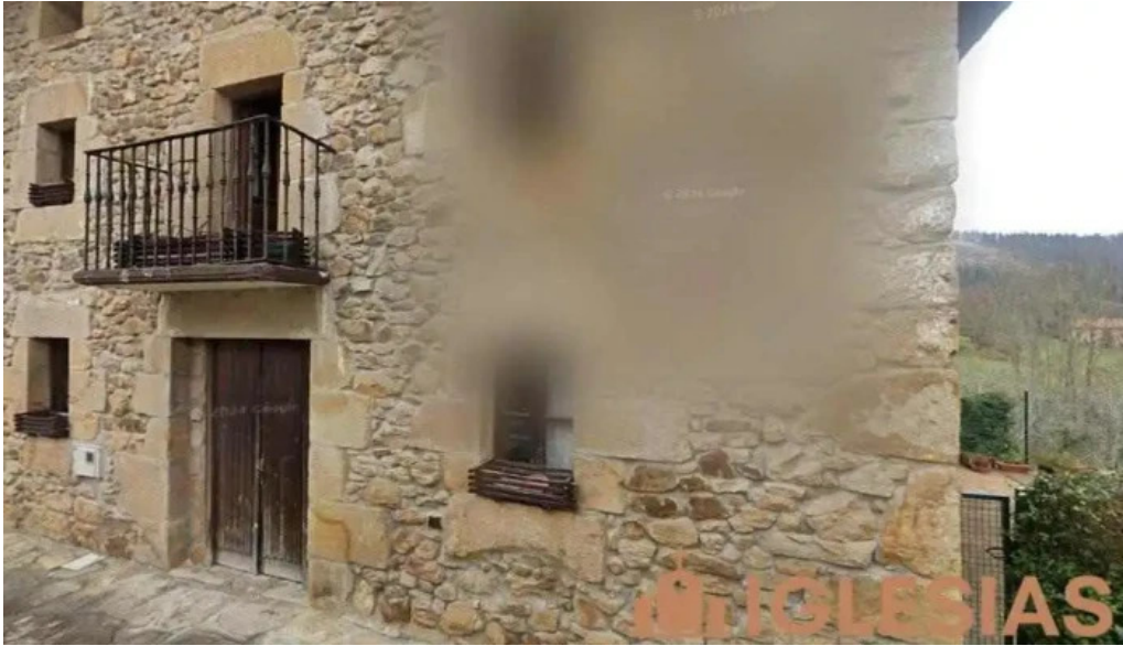
Iglesia de santa maria de gorozika muxika