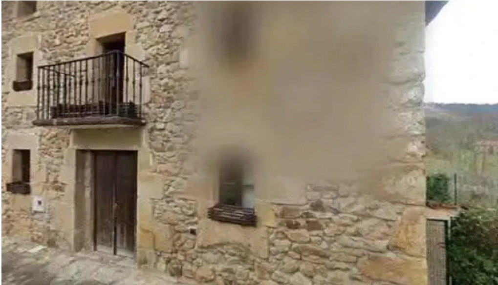
Iglesia de santa maria de gorozika iglesia