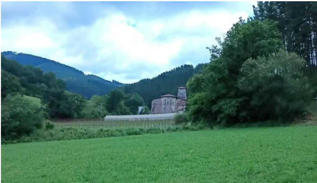
Ermita de san pedro y san pablo de ibarruri reserva de la biosfera de urdaibai