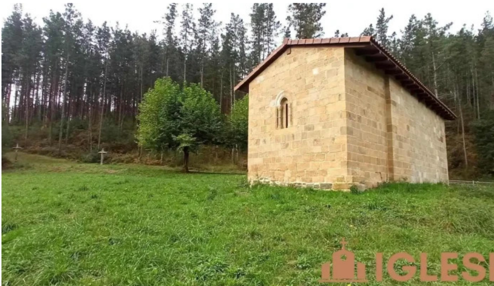
Ernita de san pedro y san pablo de ibarruri cortezubi