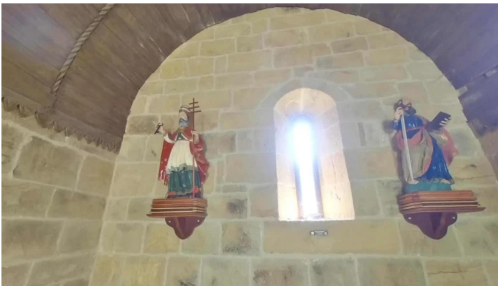
Ermita de san pedro y san pablo de ibarruri precios