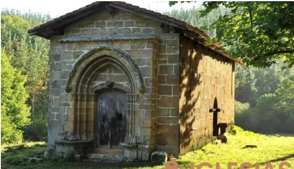
Ermita de san pedro y san pablo de ibarruri muxika