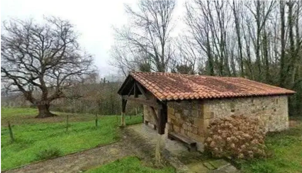
Ermita de san marcos catalogo