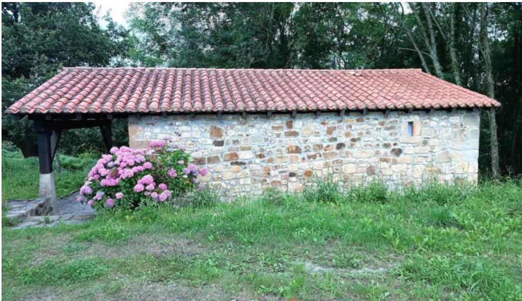
Ermite de san marcos cortezubi