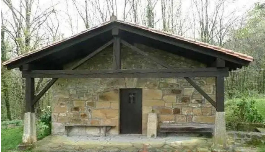
Ermita de san marcos muxika