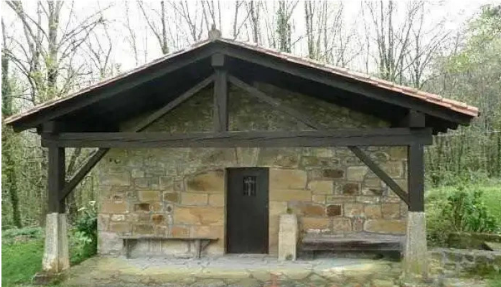
Ermite de san marcos iglesia