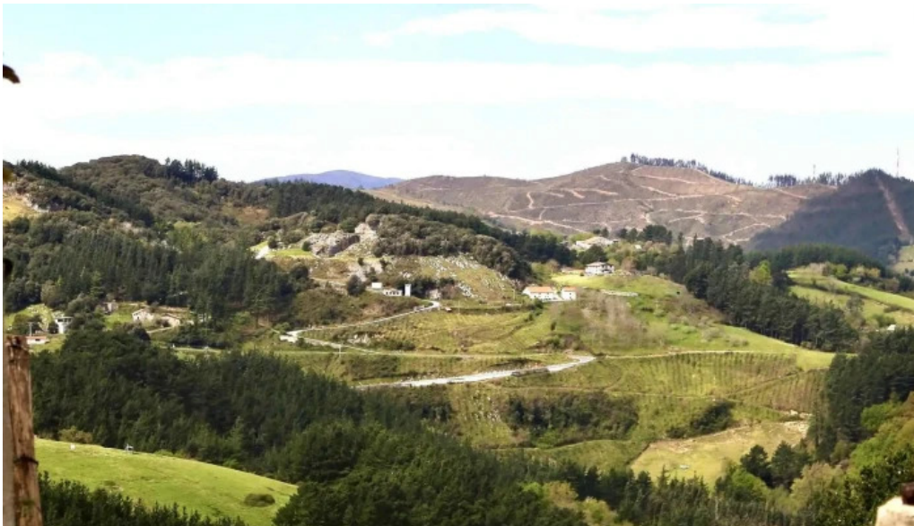
Galbario ermita mutriku