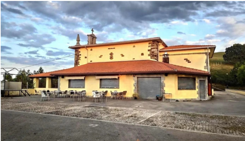
Galbario ermita iglesia