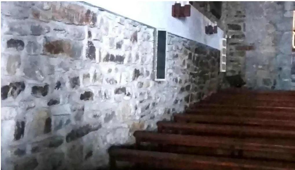
Galbario ermita videos