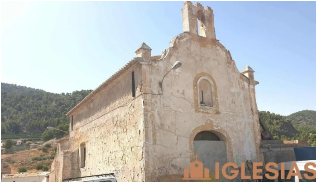
Ermita de san roque murcia