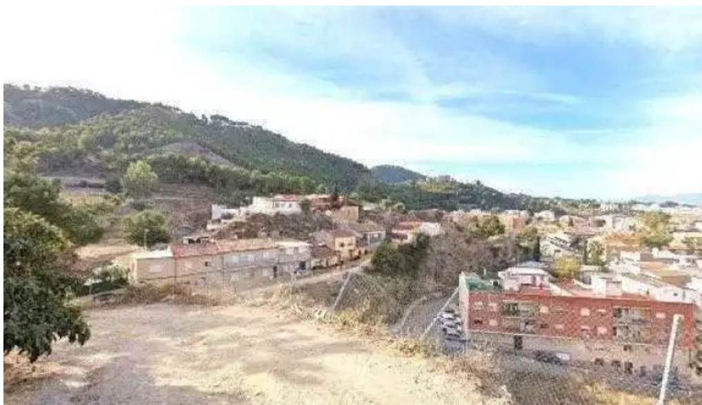
Ermita de san roque comunidad