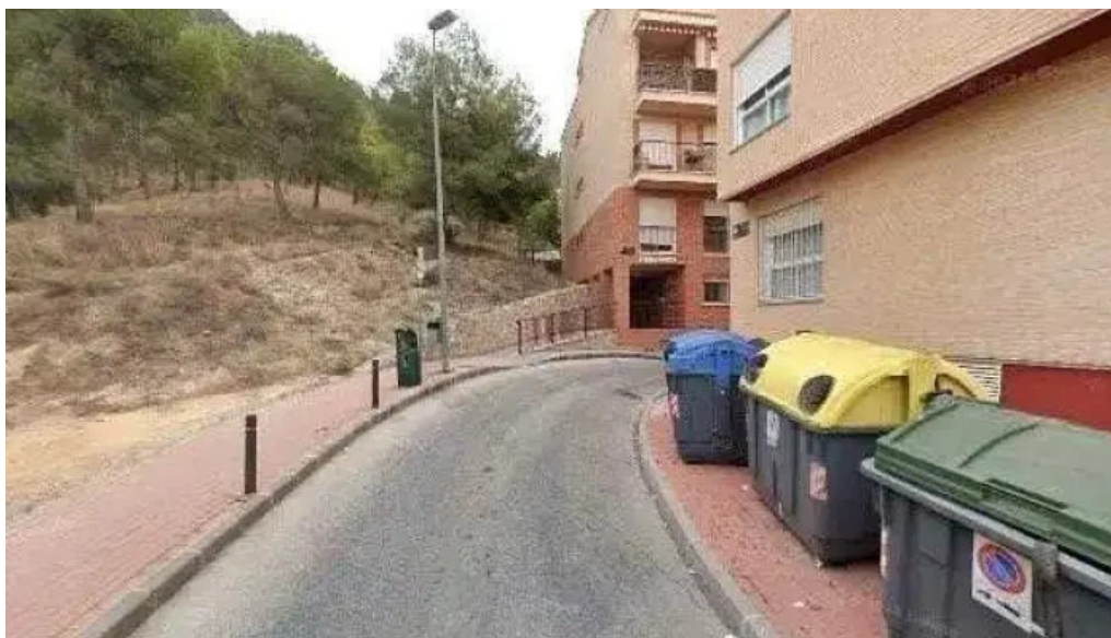
Capilla de la cruz iglesia