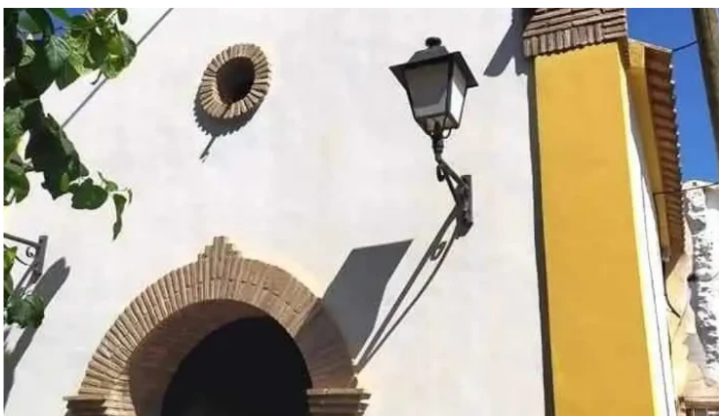
Capilla de la cruz capilla