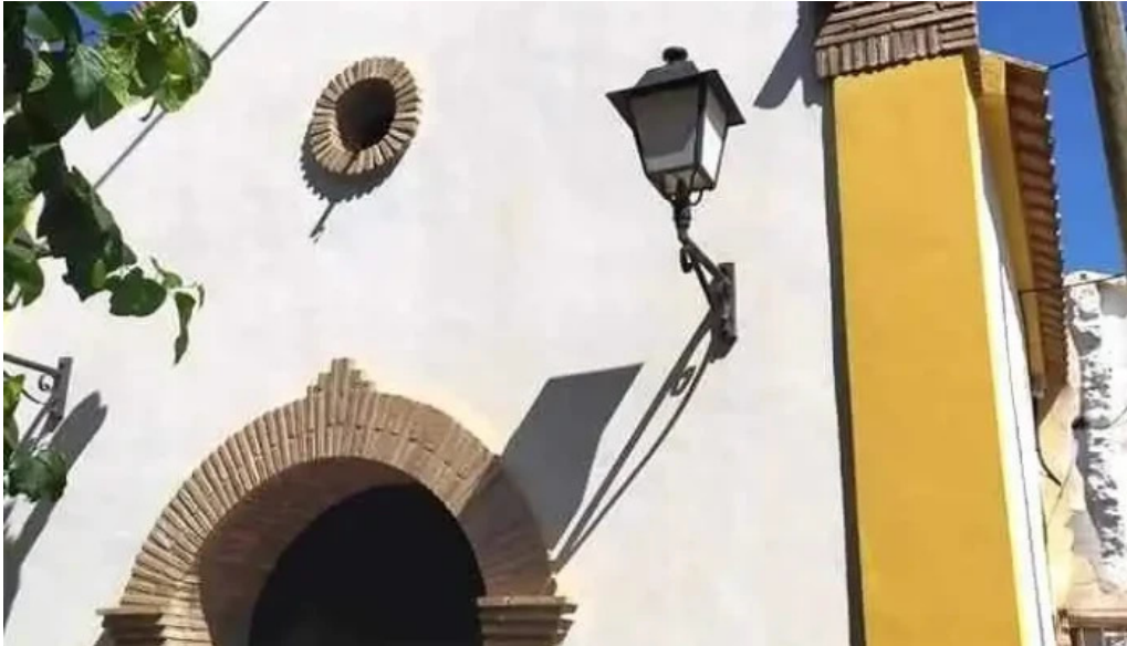
Capilla de la cruz murcia