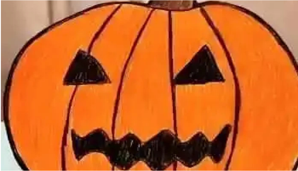
Iglesia de nuestra senora del ayedo videos