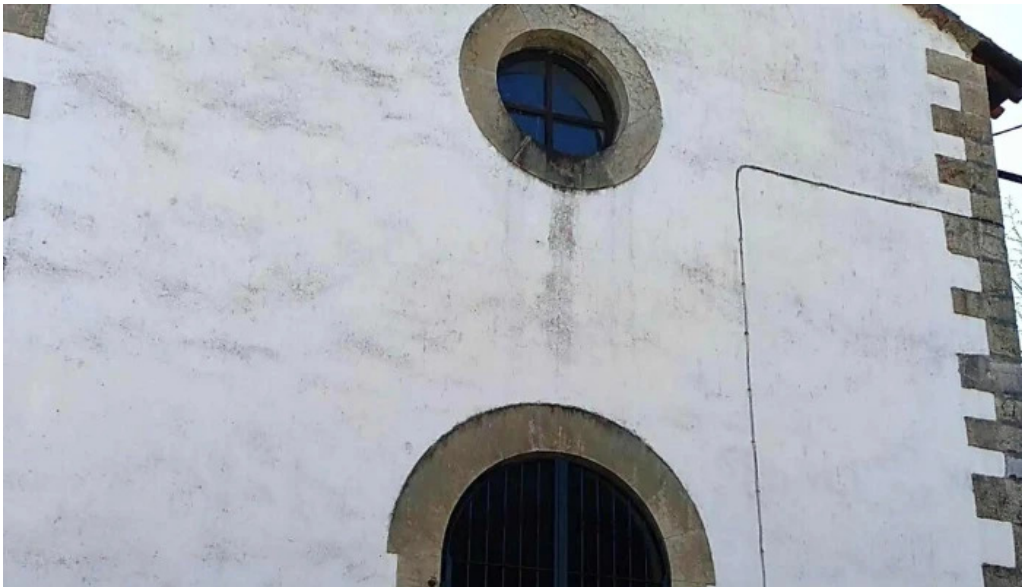
Iglesia de nuestra senora del ayedo precios