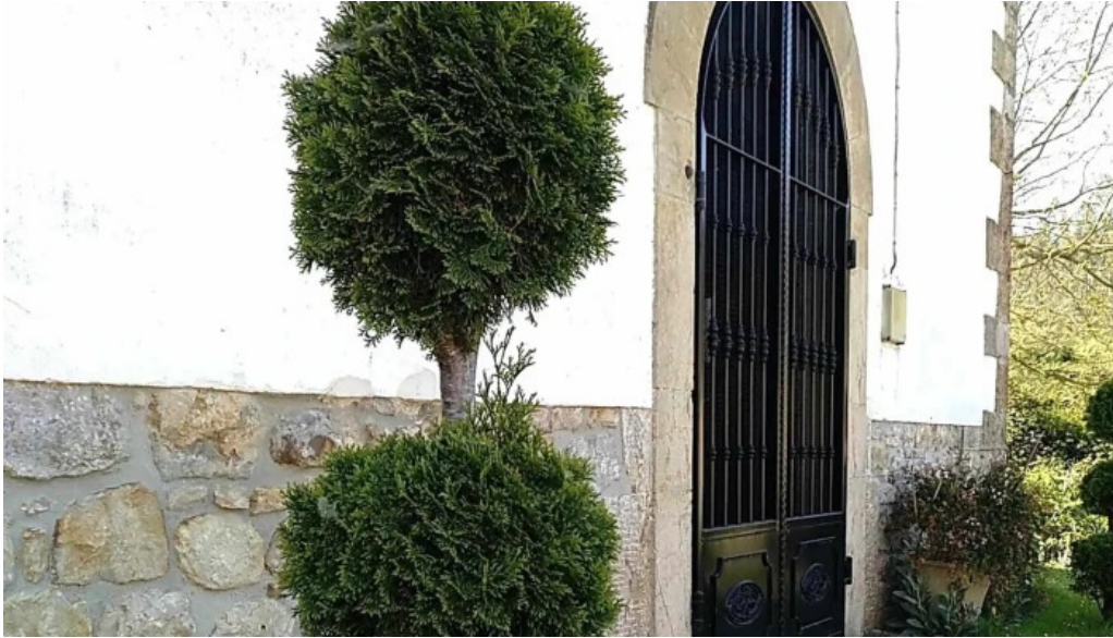
Iglesia de nuestra senora del ayedo instagram