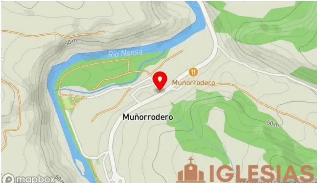
Iglesia de nuestra senora del ayedo mapa