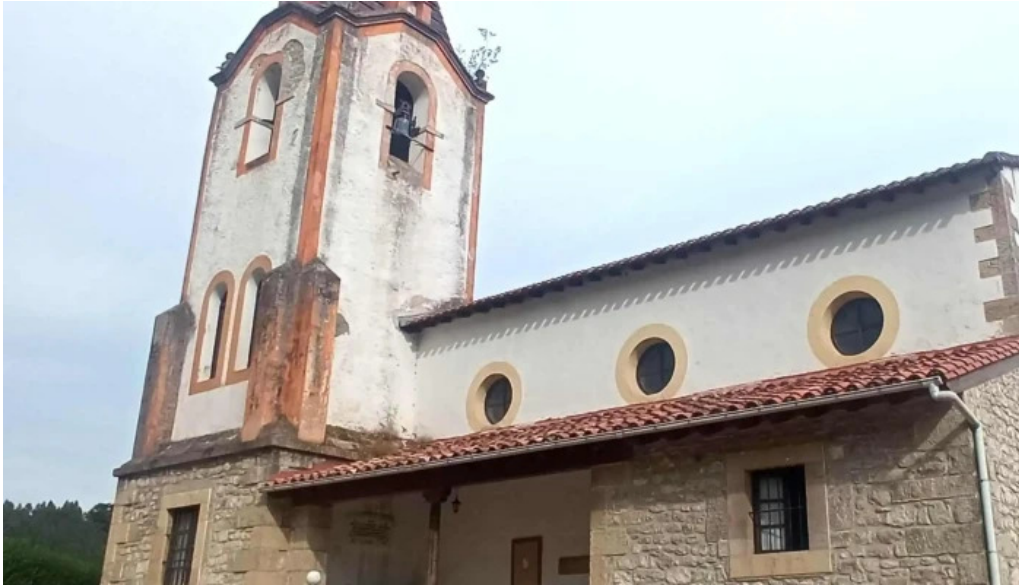
Iglesia de nuestra senora del ayedo munorrodero