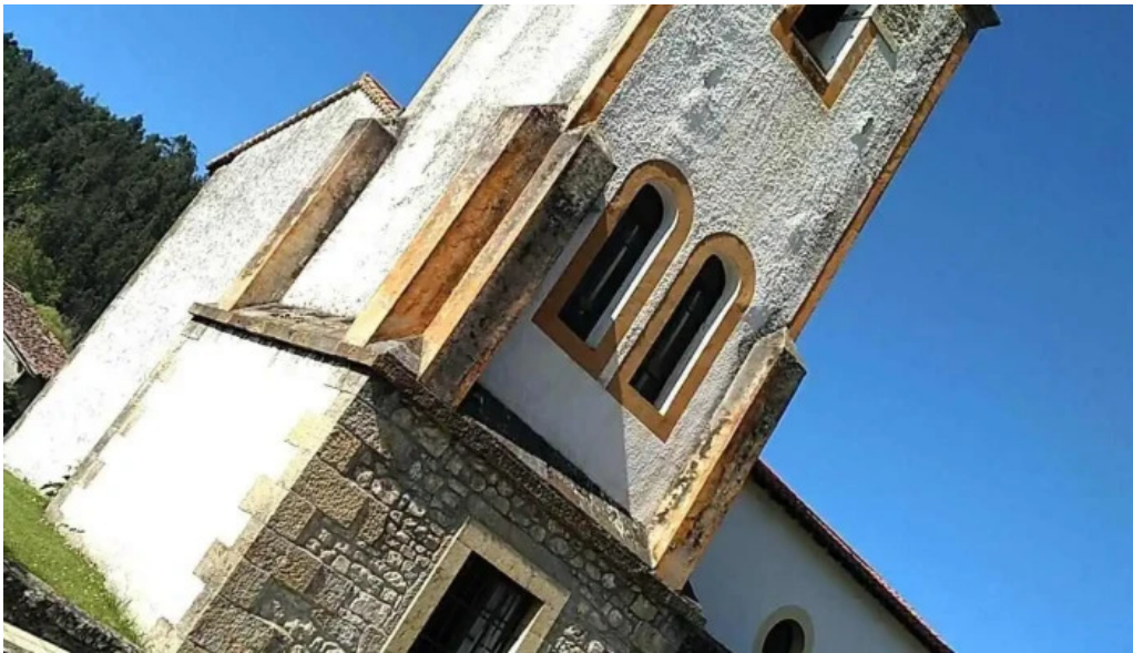
Iglesia de nuestra senora del ayedo iglesia