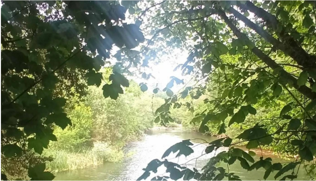
Iglesia de nuestra senora del ayedo promocion