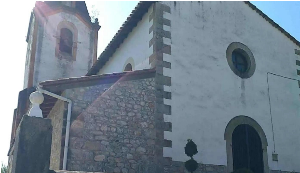
Iglesia de nuestra senora del ayedo puntaje