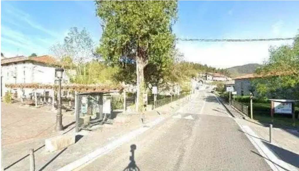
Iglesia san vicente martir iglesia