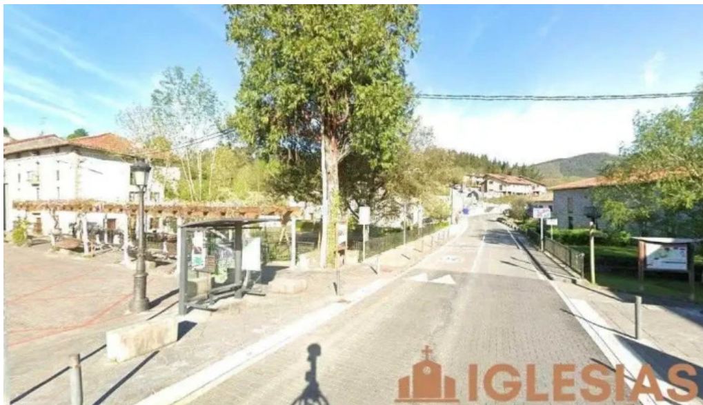
Iglesia san vicente martir munitibar arbatzegi gerrikaitz