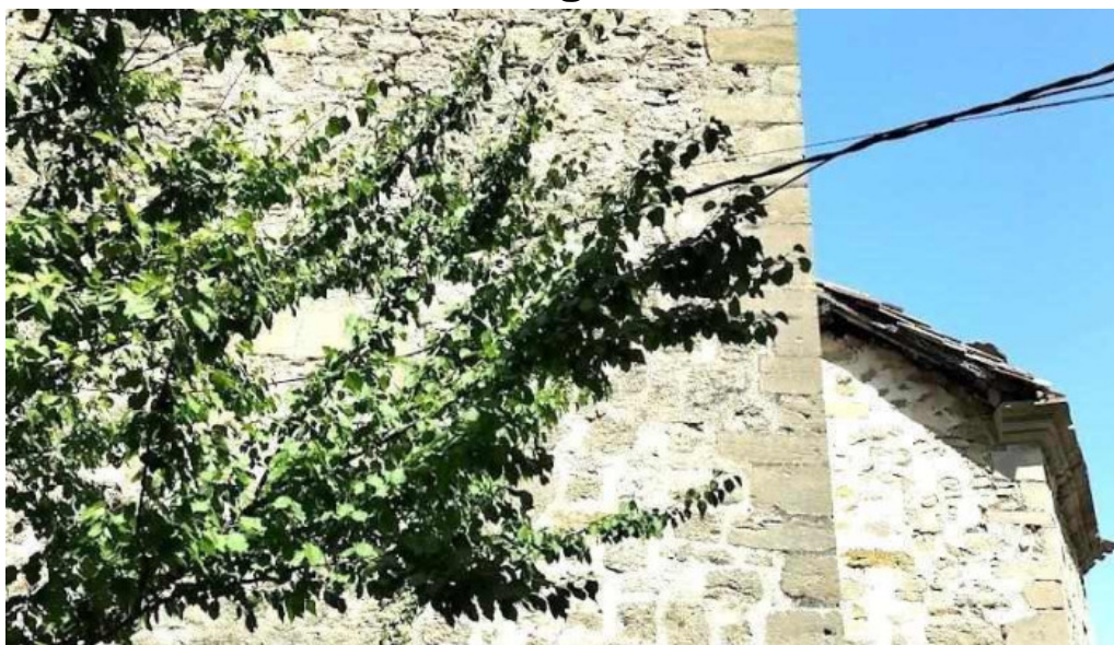
San cosme y san damian muergas