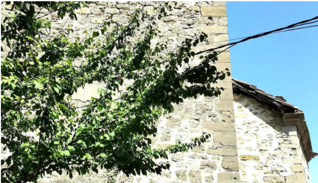
San cosme y san damian iglesia