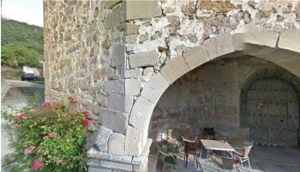
San cosme y san damian catalogo