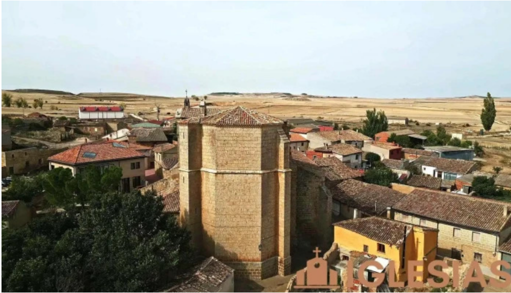
Iglesia de san esteban videos