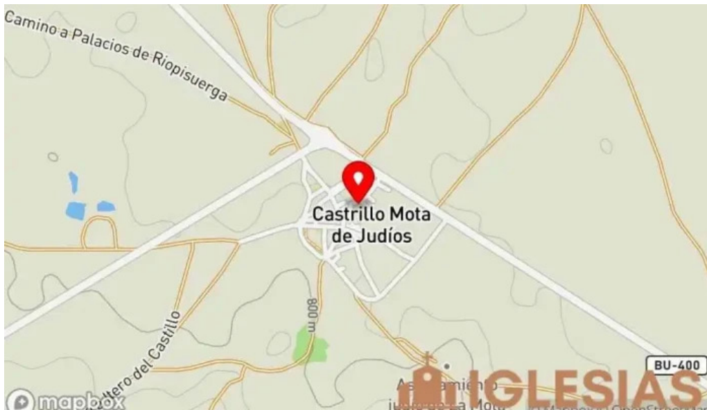
Iglesia de san esteban mapa