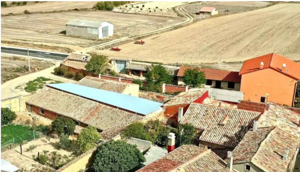
Iglesia de san esteban promocion