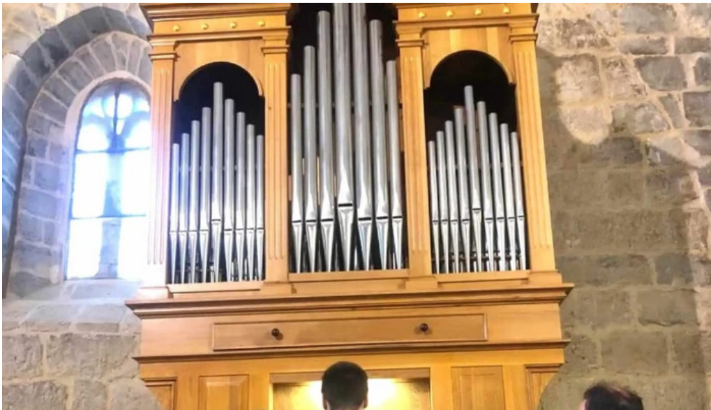
Iglesia de san esteban catalogo