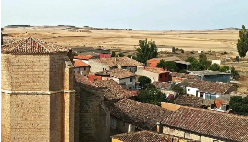
Iglesia de san esteban mota de judios