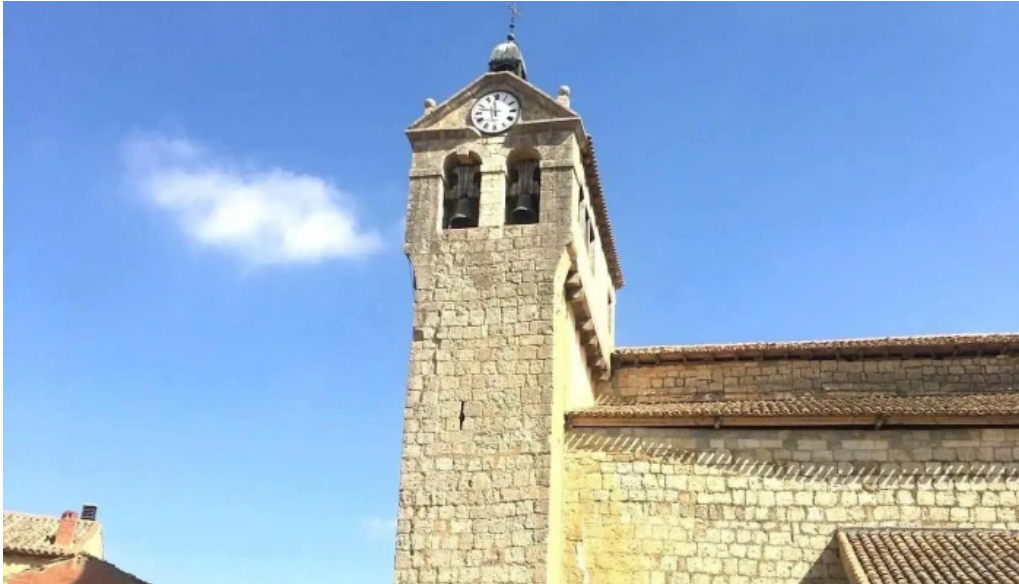
Iglesia de san esteban iglesia