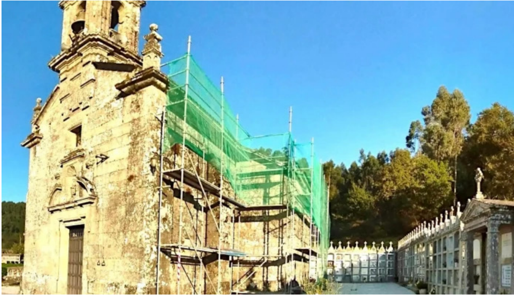
Iglesia de san mamede de amil morana