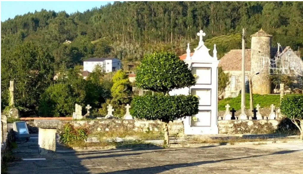
Iglesia de san mamede de amil promocion