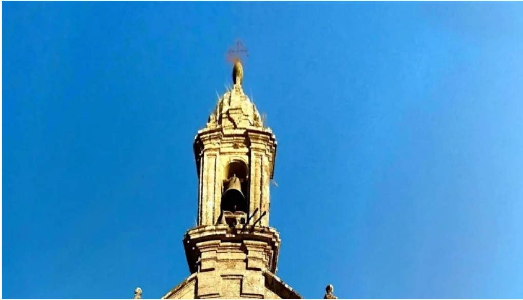
Iglesia de san mamede de amil videos