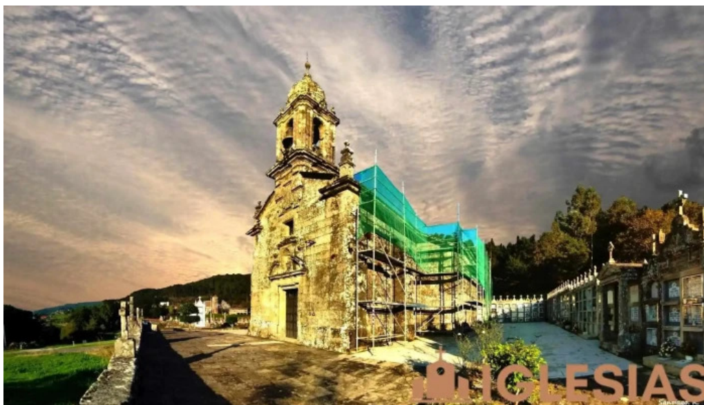
Iglesia de san mamede de amil iglesia