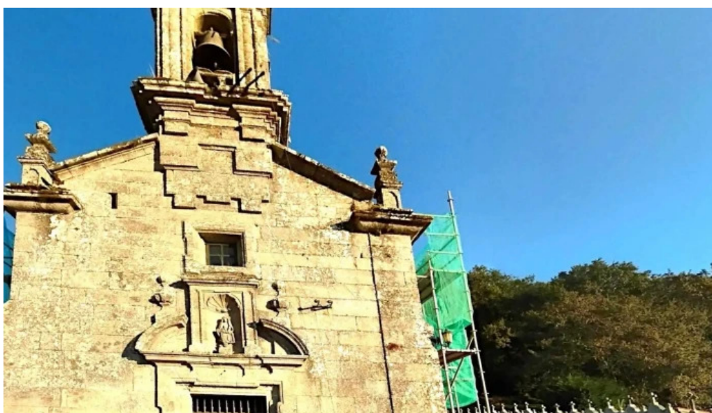
Iglesia de san mamede de amil descuentos