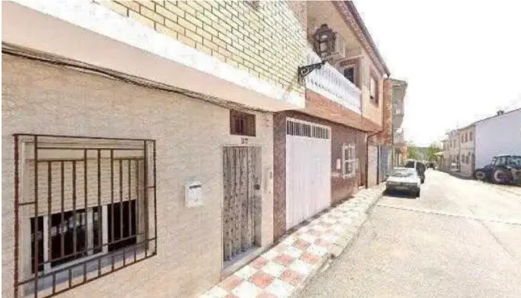
Ermita de san isidro iglesia