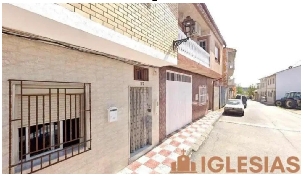
Ermita de san isidro montejicar