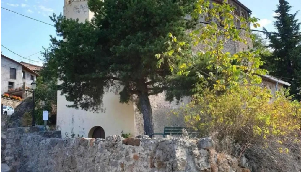
Sant marti de montcortes iglesia