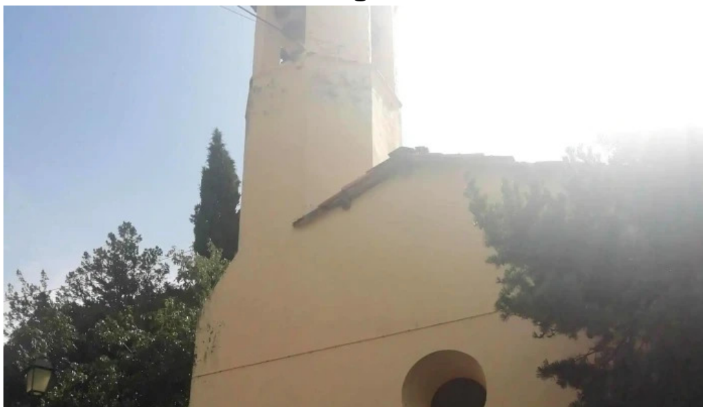
Sant marti de montcortes montcortes