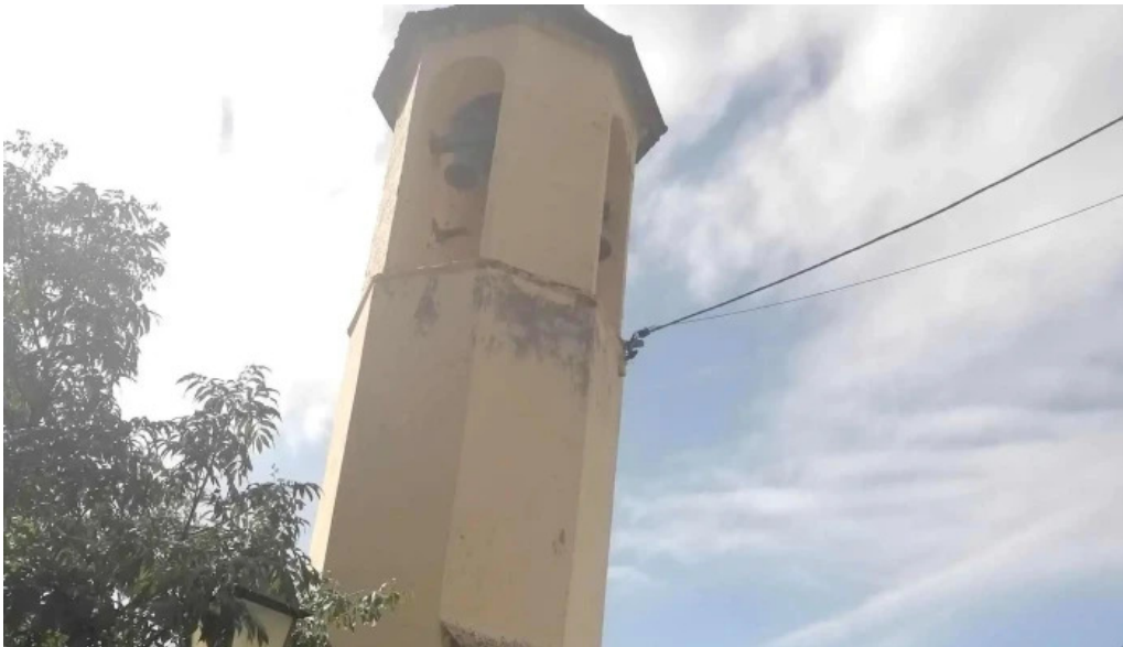
Sant marti de montcortes como llegar