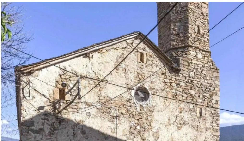
Santa cecilia iglesia