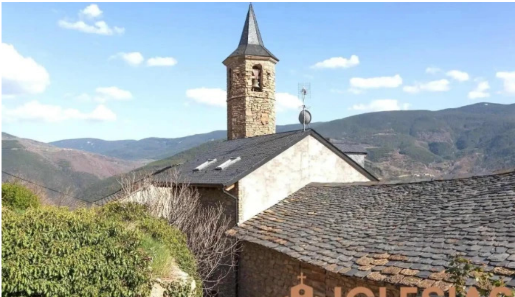
Santa cecilia montardit de dalt