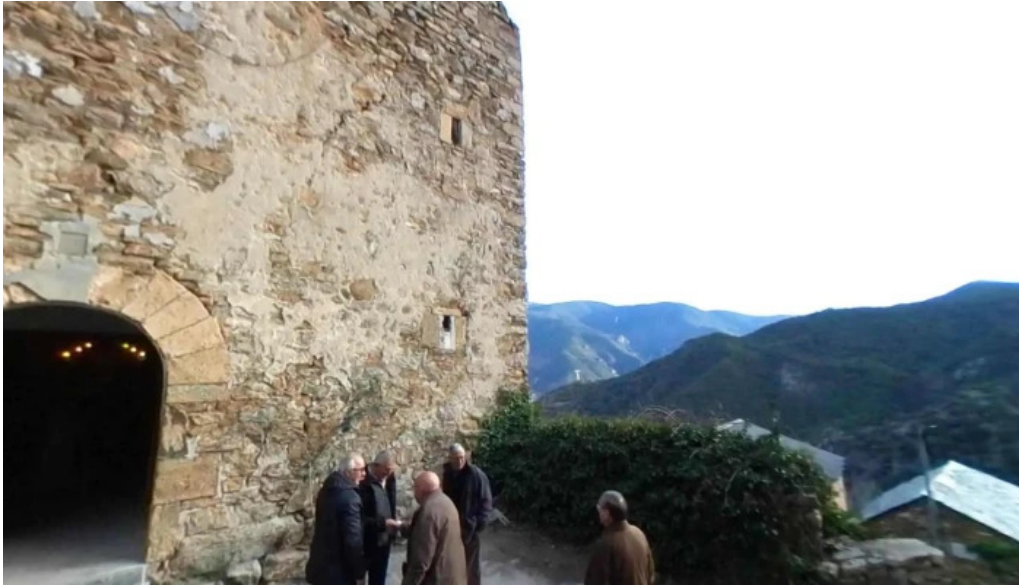
Santa cecilia numero