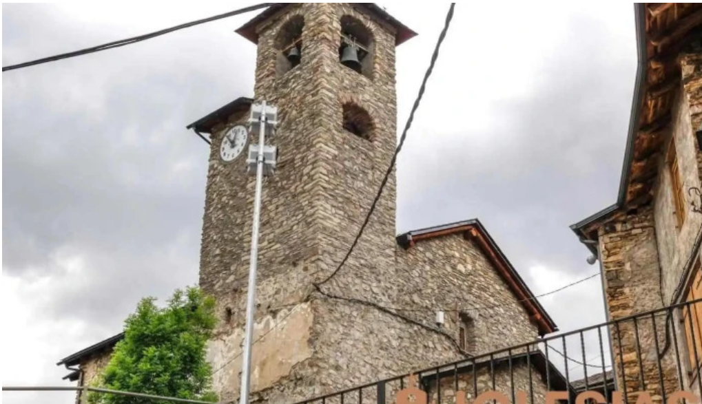
Mare de deu del boix mont ros