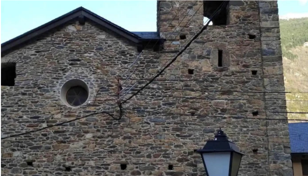
Mare de deu del boix iglesia