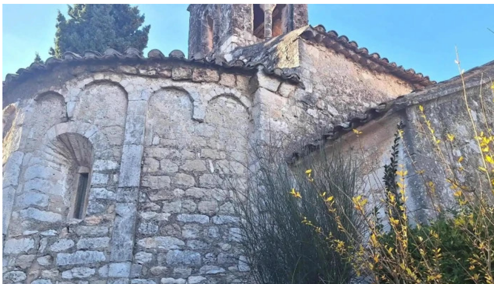
Capella romànica de sant cugat instagram