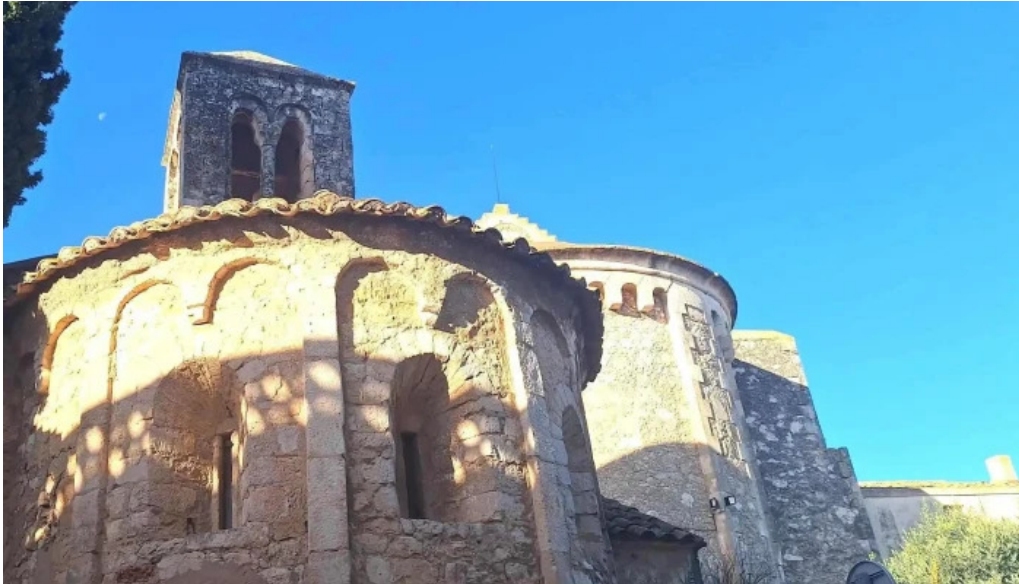
Capella romanica de sant cugat moja