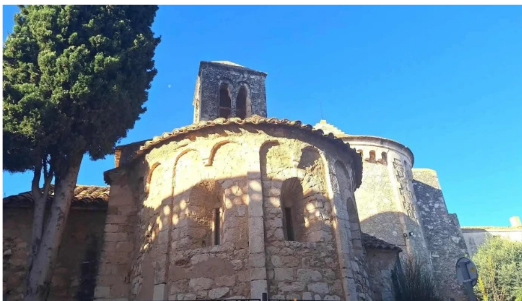
Capella romanica de sant cugat recientes