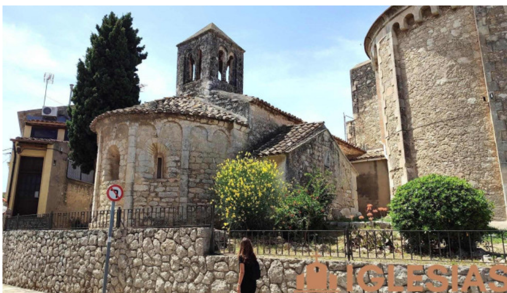
Capella romànica de sant cugat iglesia