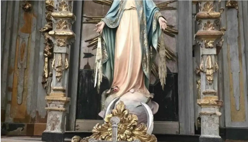
Iglesia de mogarraz iglesia