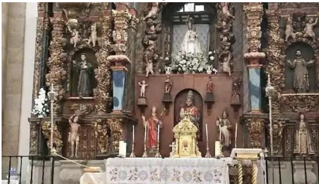
Iglesia de mogarraz mogarraz