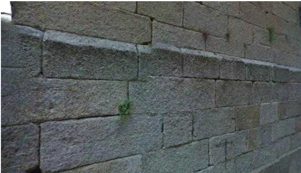
Iglesia de mogarraz donde