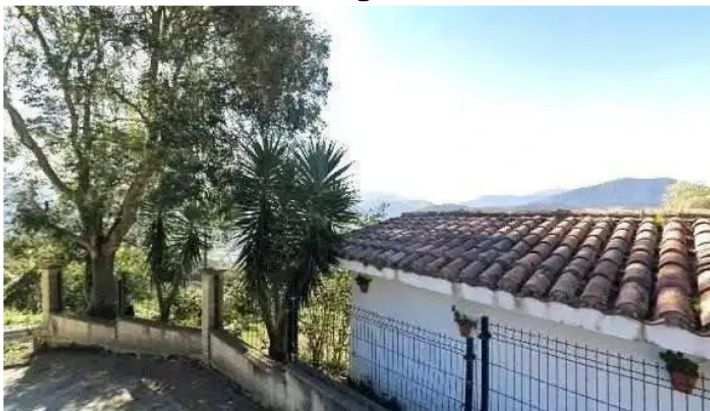
Ermita de la magdalena promocion