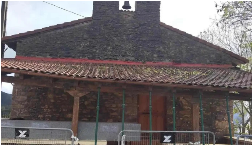
Ermita de la magdalena iglesia