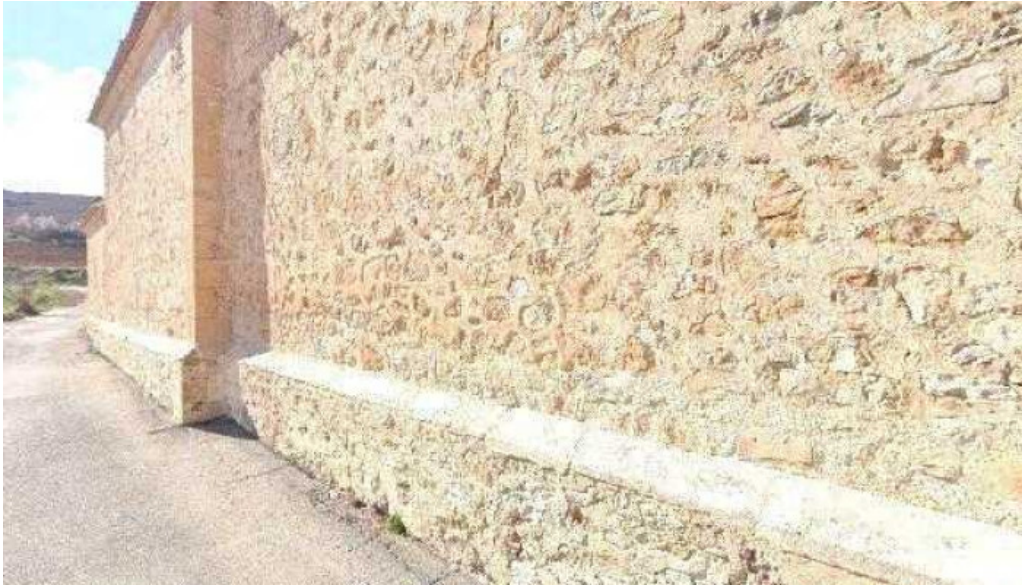
Ermita de Jesus Nazareno zona