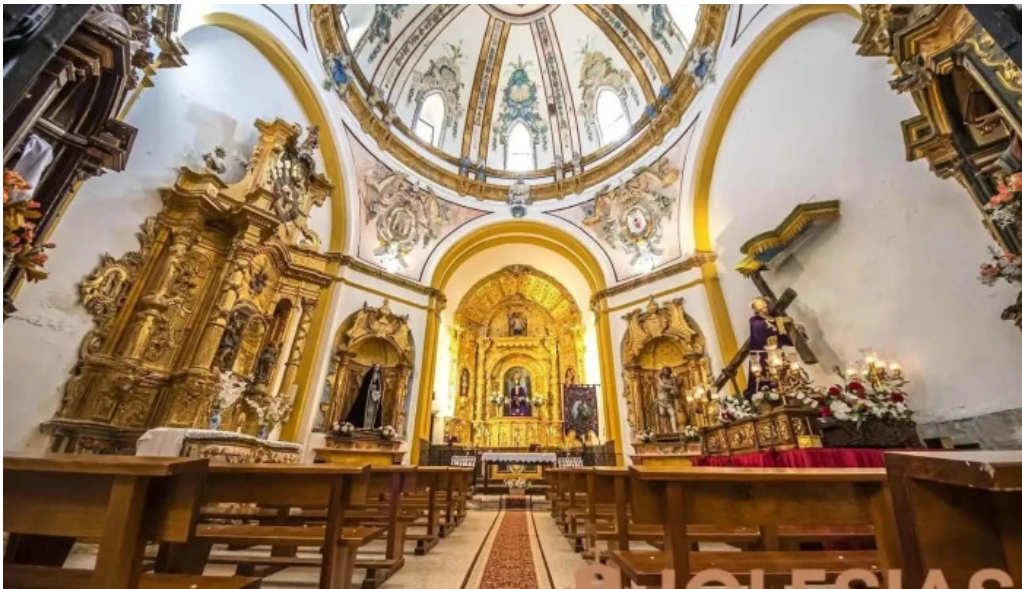
Ermita de Jesus Nazareno milmarcos