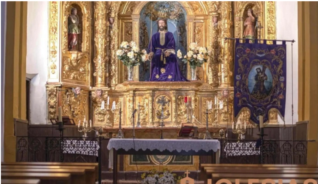
Ermita de Jesus Nazareno iglesia